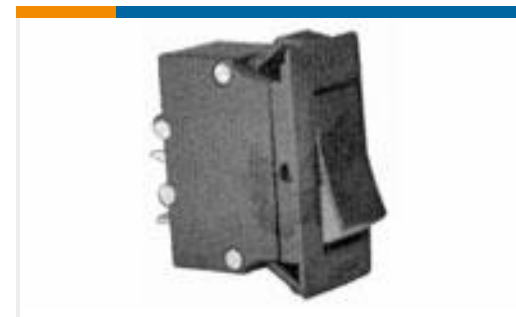
TE 产品编号4-1423673-0 W51-A152A1-10=CKTBKR,THERM, ROC