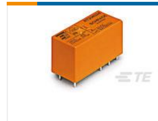
TE 产品编号9-1393239-1 RT314005