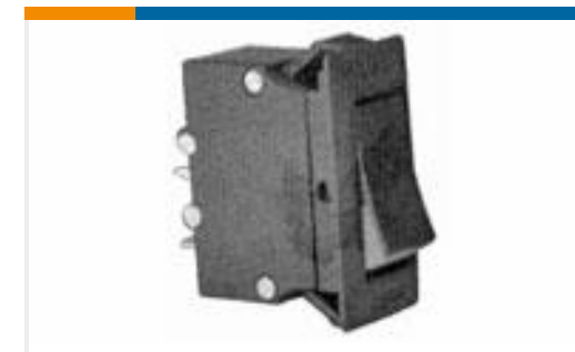
TE 产品编号3-1423673-9 W51-A152A1-5=CKTBKR,THERM,ROC