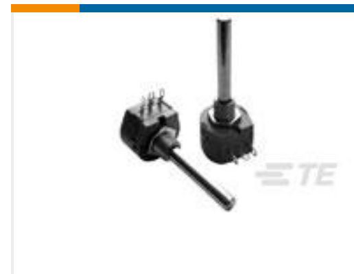
TE 产品编号1676979-4 TW 1W 10K 6.35X25PL