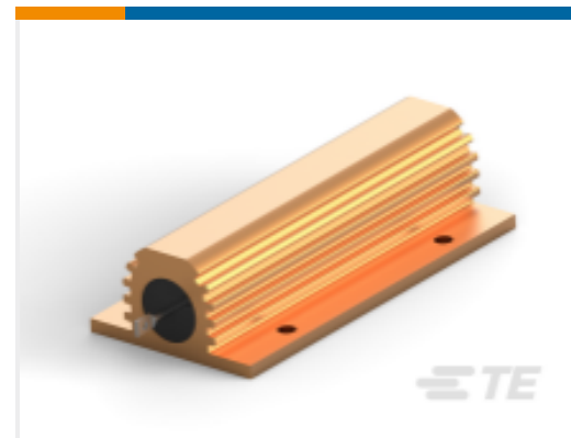
TE 产品编号3-1625999-6 功率电阻器：铝壳体，HSC