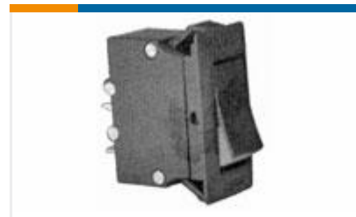
TE 产品编号1-1423673-6 W51-A151A1-7=CKTBKR,THERM, ROCK