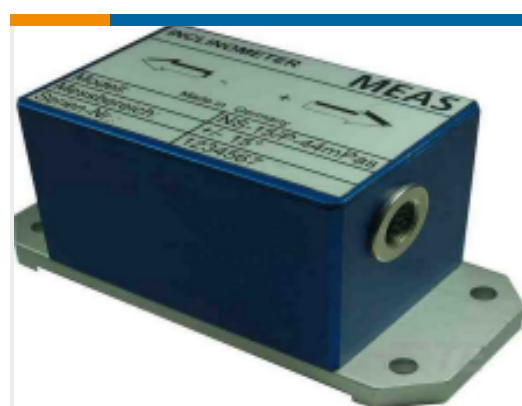
TE 产品编号 G-NSP2-001 NS-5/P2 2MPAS