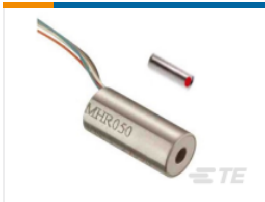
TE 产品编号02560408-000 小型轻量 LVDT