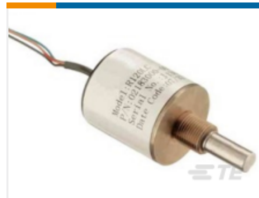
TE 产品编号66530072-000 R-FLEX CPLG ADP RVIT/RVDT/RSYN