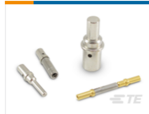
TE 产品编号0462-005-20141 DEUTSCH 实芯端子