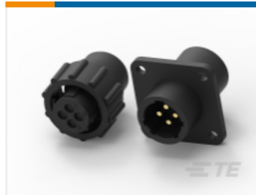
TE 产品编号211400-1 CPC 系列 1