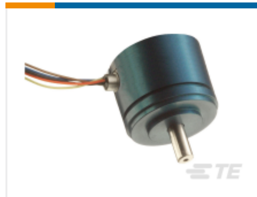
TE 产品编号02560231-140 R30A 10KHZ +/-40 DEGREES