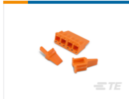
TE 产品编号WM-12S DEUTSCH DTM 楔形锁紧装置