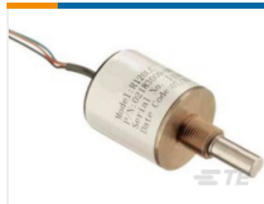
TE 产品编号66530072-000 R-FLEX CPLG ADP RVIT/RVDT/RSYN