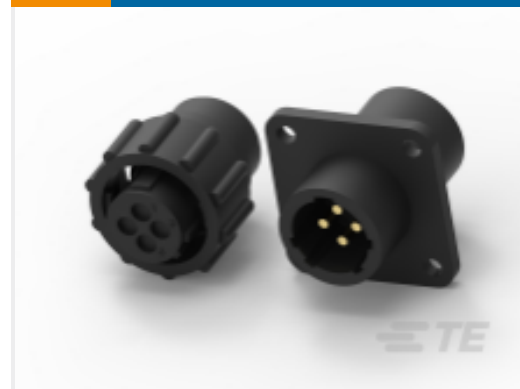
TE 产品编号211400-1 CPC 系列 1