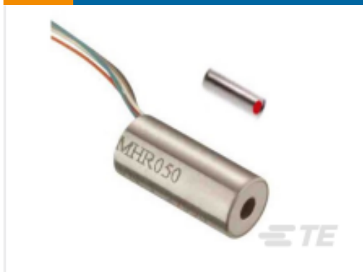
TE 产品编号02560408-000 小型轻量 LVDT