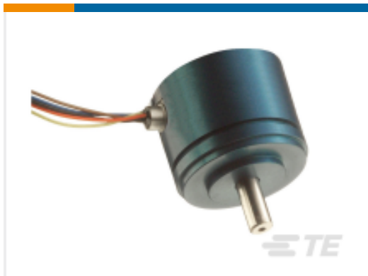
TE 产品编号02560231-000 RVDT R30A ASSY