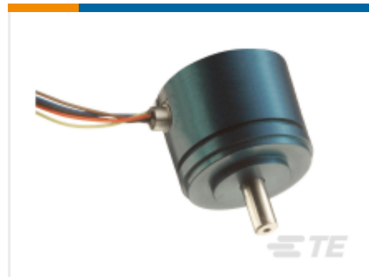
TE 产品编号02560231-140 R30A 10KHZ +/-40 DEGREES