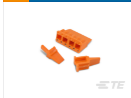
TE 产品编号WM-12S DEUTSCH DTM 楔形锁紧装置