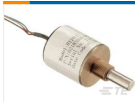
TE 产品编号66530072-000 R-FLEX CPLG ADP RVIT/RVDT/RSYN