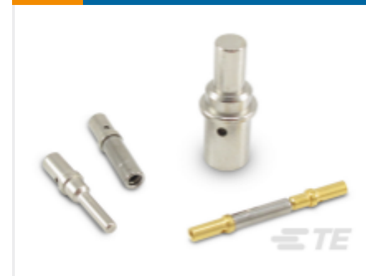
TE 产品编号0462-005-20141 DEUTSCH 实芯端子