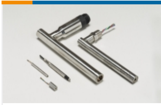
线性位移传感器 - LVDT(46)