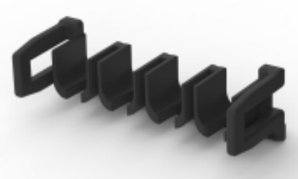
TE 产品编号 CAT-P87074-T669 三重锁定电源连接器端子锁定片