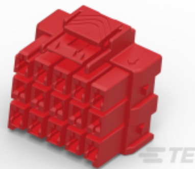
TE 产品编号 CAT-P87074-P729A 三重锁定电源连接器高温插头