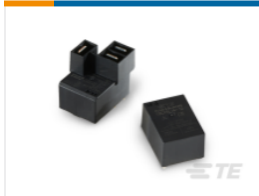
TE 产品编号1558676-1 PCB 功率继电器：30 安培，单稳直流