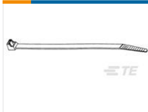
TE 产品编号1-608692-0 CABLE TIE,RELEASABLE,BLK,100PK