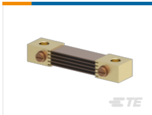
TE 产品编号CK0345-000 CI-FH5050