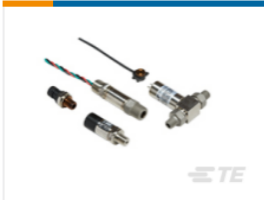
TE 产品编号10201889-00 压力传感器 (现货)