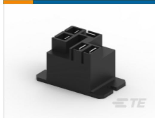
TE 产品编号1-1649341-9 T9CP5A54-120