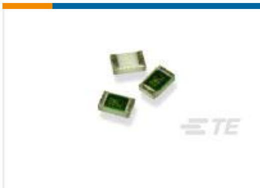
TE 产品编号1-1879225-7 CPF 0603 57K6 0.1% 25PPM 1K RL