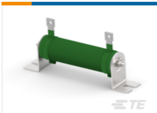
TE 产品编号1-1879451-8 线绕电阻器: 矿物, 2.5 Kw