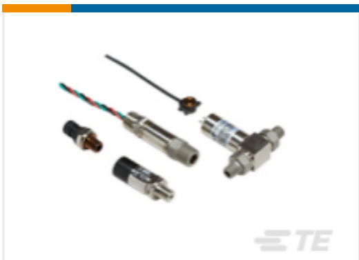
TE 产品编号10202024-00 压力传感器 (现货)