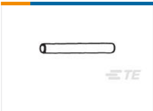
TE 产品编号1445886-6 RET PIN, SNAP-IN RECEPTACLE