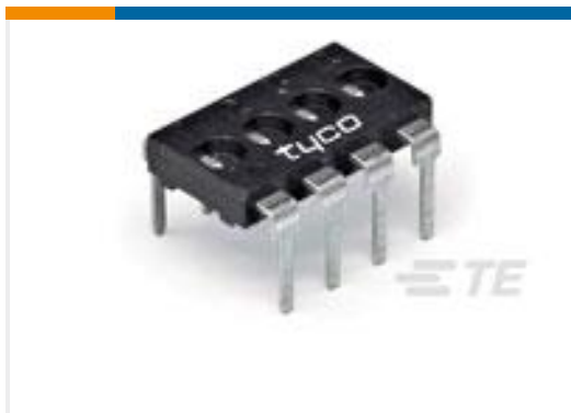
TE 产品编号1825190-5 DIP Shunt,6 pos