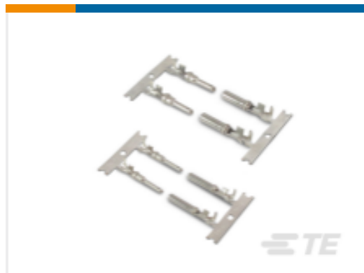
TE 产品编号1060-16-0622 DEUTSCH 冲压成型端子