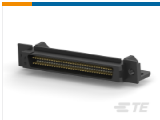
TE 产品编号2-5174225-5 D-Sub 插头组件：标准，直角，1.27 mm