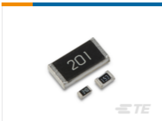
TE 产品编号2176329-1 CRGP 1210 10R 1%