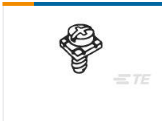
TE 产品编号1437651-2 511611100=6 W/C-STEEL-COMBO