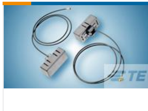
TE 产品编号1513472-1 UAM Assembly