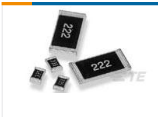
TE 产品编号1623181-1 CRG0805 1% 2K7