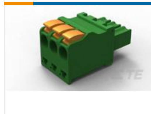
TE 产品编号1986722-4 STR PLUG SPRING TYPE LH 4P, 3.81 mm