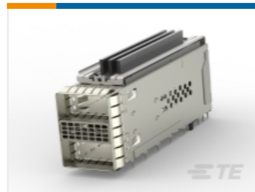
TE 产品编号2299940-2 ZQSFP+ STACKED REC ASSEMBLY 2X1,HS