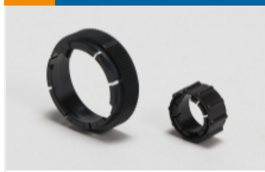
电路连接器适配器(2)