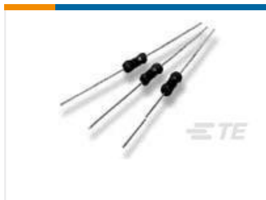
TE 产品编号1625889-6 2W SM M/OX 2% 6R8 REELED