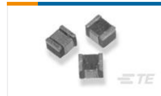
TE 产品编号3-1624112-8 3650 0402 7.5nH 5% 2K RL