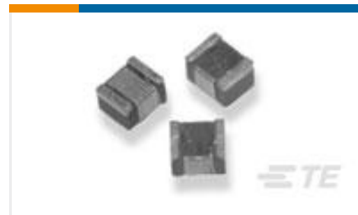
TE 产品编号5-1624112-2 3650 0402 33nH 5% 2K RL