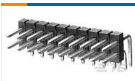
TE 产品编号5-102975-4 08 MODII HDR DRRA B/A .100CL