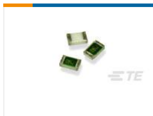
TE 产品编号2-1879335-9 CPF 0603 42R2 1% 50PPM 1K RL