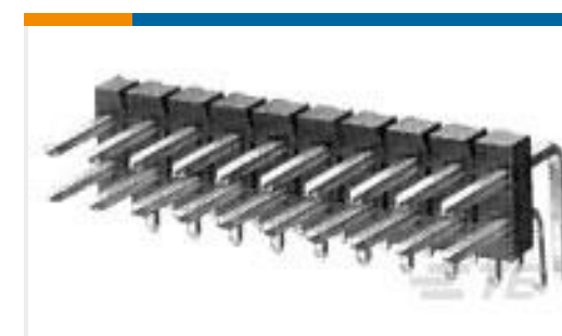
TE 产品编号102975-4 08 MODII HDR DRRA B/A .100CL