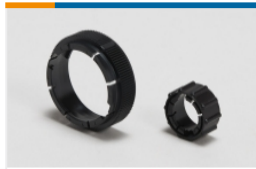
电路连接器适配器(2)