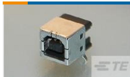
TE 产品编号292304-5 STD USB TYPE B, R/A, T/H, 30U" AU