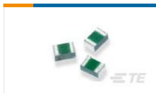
TE 产品编号1624357-2 NTC0805 5% 30K