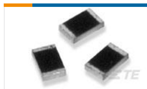
TE 产品编号1-1879743-0 RP 1J 5R9 0.1% 15PPM CUT LENGTH