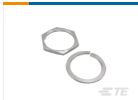
TE 产品编号112263-90 DEUTSCH HD30 安装硬件