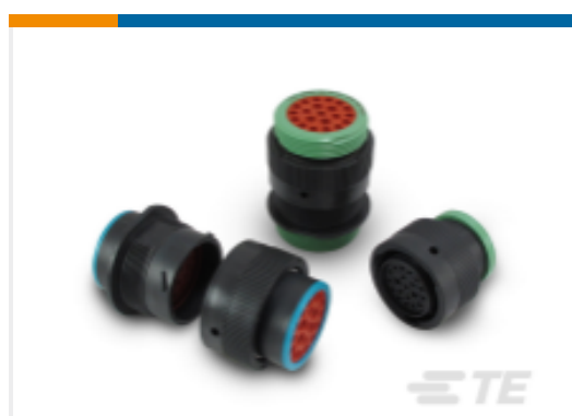
TE 产品编号YHDP26-24-35PEL017 DEUTSCH HDP20 壳体