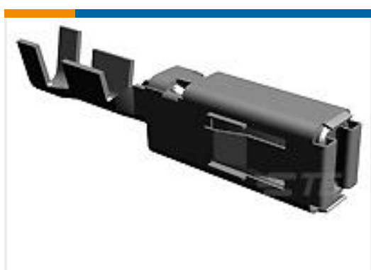
TE 产品编号1-968874-3 AMP MCP 2.8, CONTACT (LP)