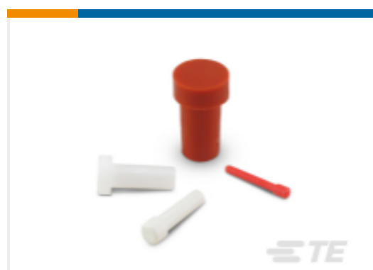
TE 产品编号114017-ZZ DEUTSCH 密封盲堵