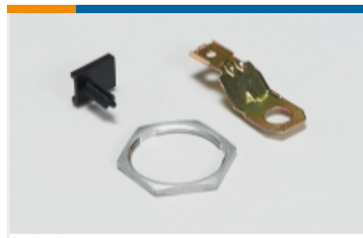
其他汽车连接器附件(14)