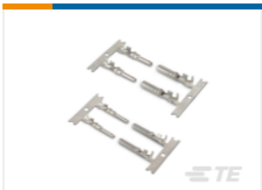
TE 产品编号1062-16-0144 DEUTSCH 冲压成型端子