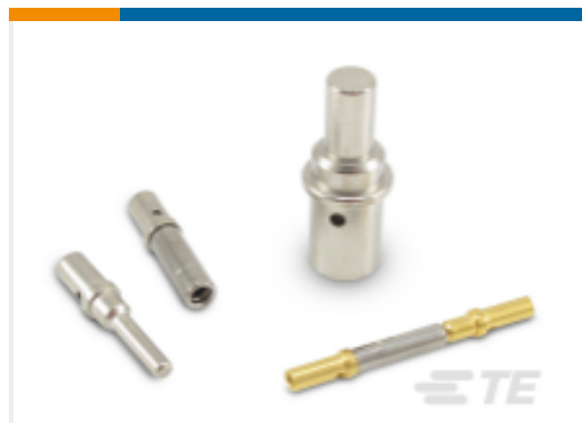
TE 产品编号0462-203-04141 DEUTSCH 实芯端子