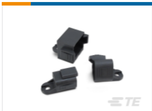
TE 产品编号1011-345-0305 DEUTSCH DT 防尘帽