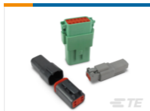
TE 产品编号DT04-2P 德驰 DT 系列塑壳和连接器