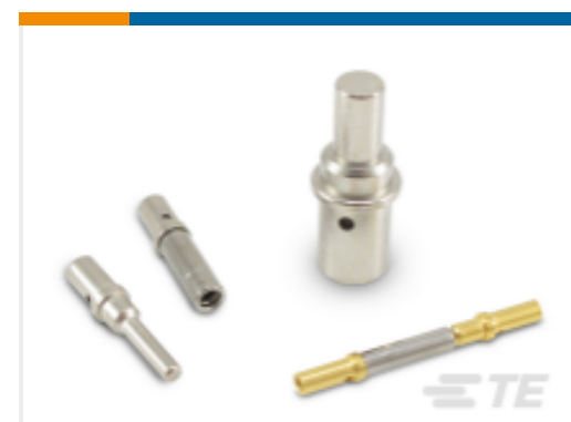
TE 产品编号0462-203-12141 DEUTSCH 实芯端子