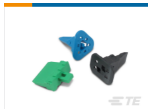
TE 产品编号W8S DEUTSCH DT 楔形锁紧装置