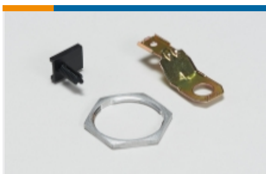
其他汽车连接器附件(11)