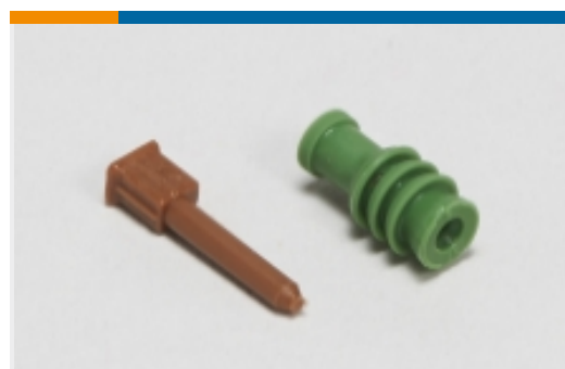
汽车密封件和盲堵(10)