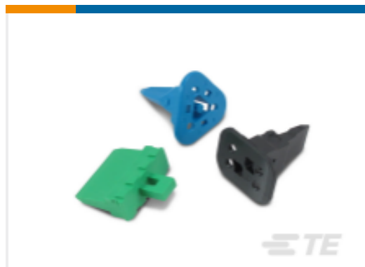
TE 产品编号W6P DEUTSCH DT 楔形锁紧装置