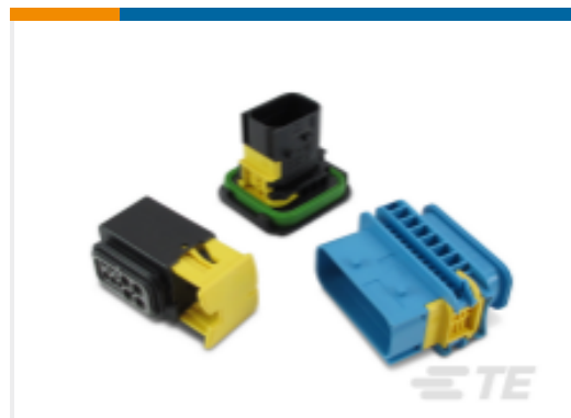
TE 产品编号2-1418437-1 重载密封连接器壳体