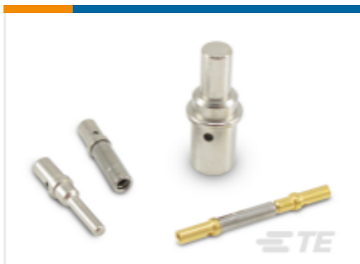
TE 产品编号0462-201-20141 DEUTSCH 实芯端子