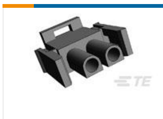
TE 产品编号1-480698-0 02P UMNL PLUG HSG NATL