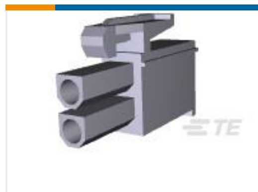
TE 产品编号1-172165-9 2CIR MINI U-M-N-L PLUG BLCK