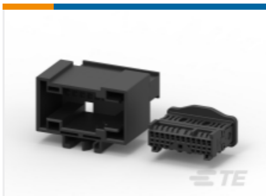
TE 产品编号953698-3 MQS, 连接器壳体