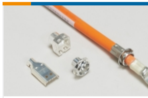
汽车连接器 EMC 屏蔽(2)