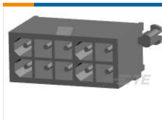
TE 产品编号1-770858-0 10P MINI UMNL HDR ASSY SNDBL L