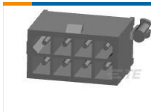
TE 产品编号1-794073-0 08P MINI UMNL HDR W/O DH SN LF