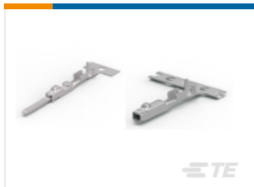
TE 产品编号1563719-1 MCON, 母端和公端