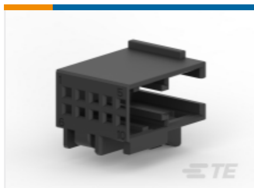
TE 产品编号1-2177198-1 COVER,10 POS. MQS,BL