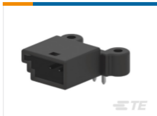
TE 产品编号1-1418647-5 信号接头