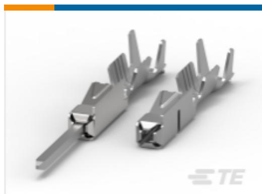
TE 产品编号1-928918-1 MQS, 母端和公端