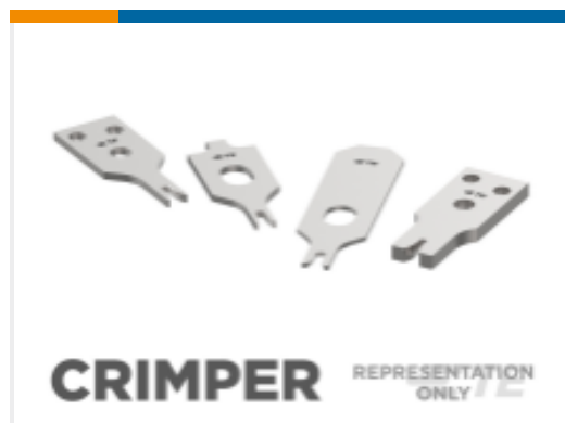
TE 产品编号1-1803223-5 CRIMPER, INSULATION F PREMIUM