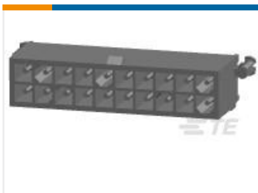
TE 产品编号1-794070-0 20P MINI UMNL HDR W/DH SN LF