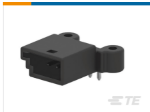
TE 产品编号1-967657-1 信号接头