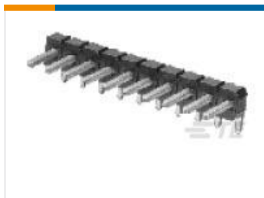
TE 产品编号1-826631-0 AMPMODU II R/A DR HEADER