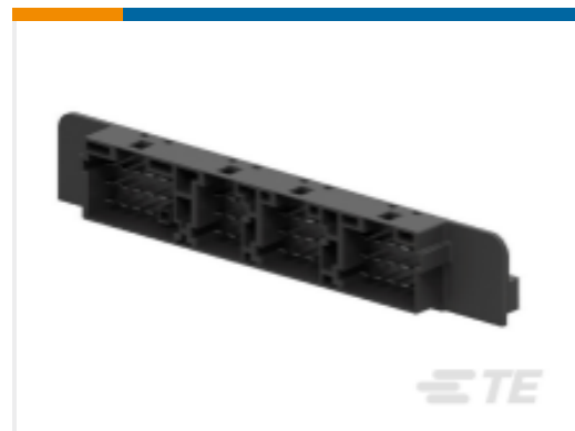
TE 产品编号1241434-2 高插针数接头