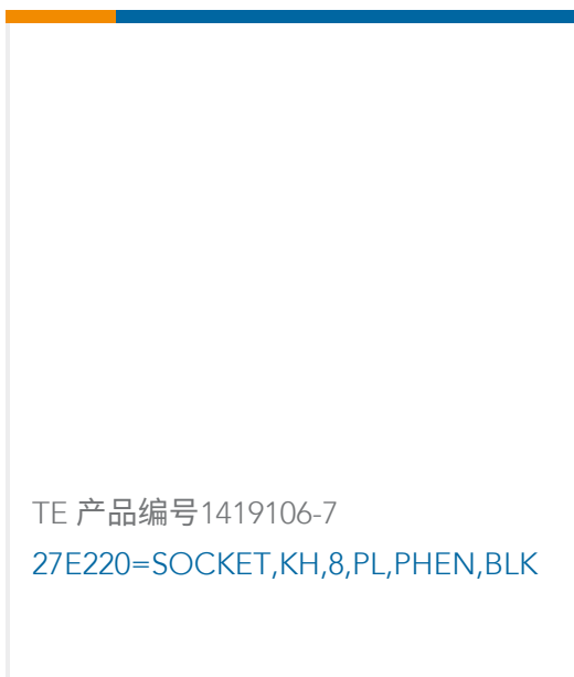
TE 产品编号1419106-7 27E220=SOCKET,KH,8,PL,PHEN,BLK