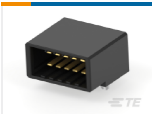
TE 产品编号1-178317-5 Dynamic 3100 HDR 组件