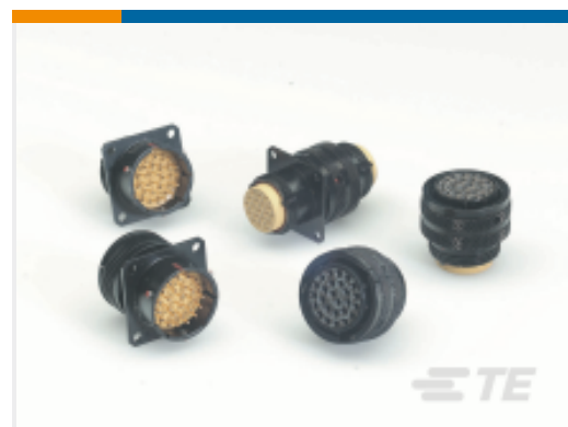
TE 产品编号ZPF00000000019313 FDBA 56-14-19 SN-K-A5559