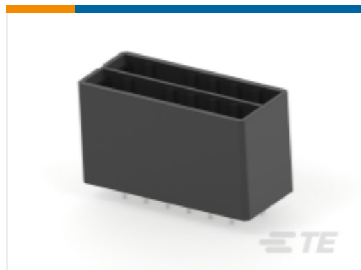
TE 产品编号1-917337-5 Dynamic 3200 HDR 组件