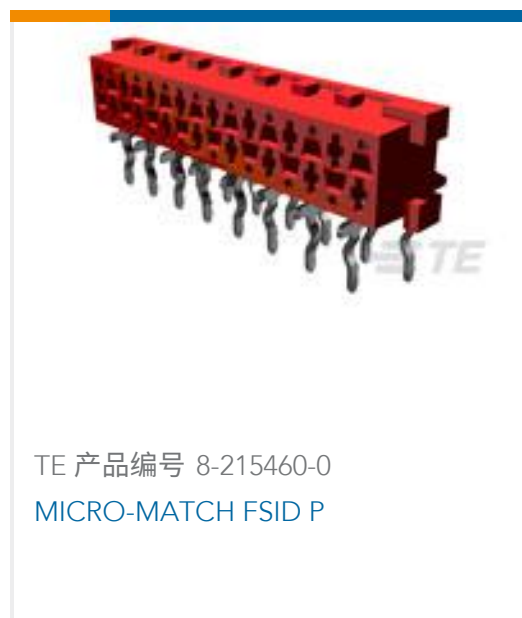
TE 产品编号 8-215460-0 MICRO-MATCH FSID P