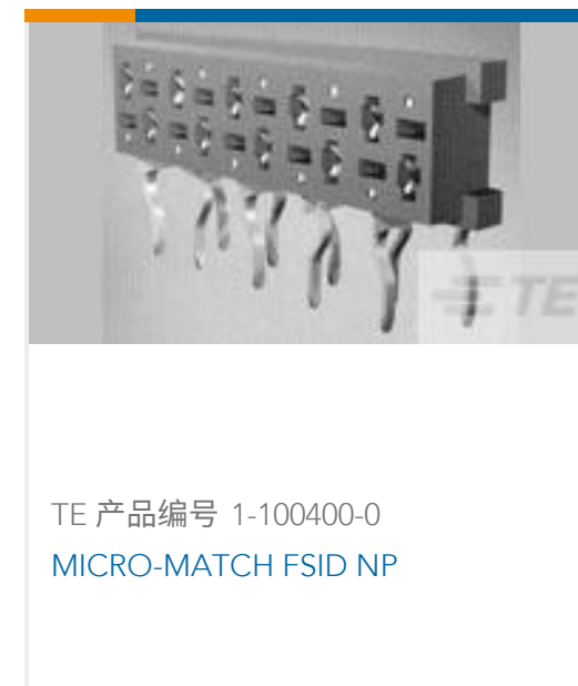
TE 产品编号 1-100400-0 MICRO-MATCH FSID NP