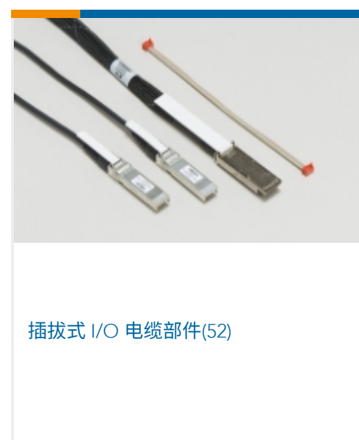
插拔式 I/O 电缆部件(52)