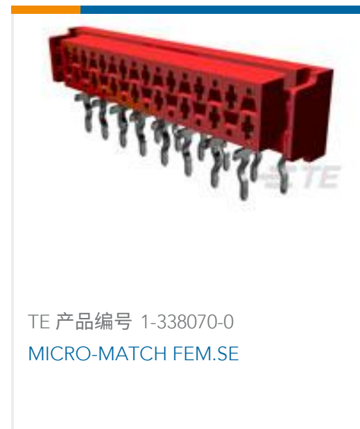
TE 产品编号 1-338070-0 MICRO-MATCH FEM.SE