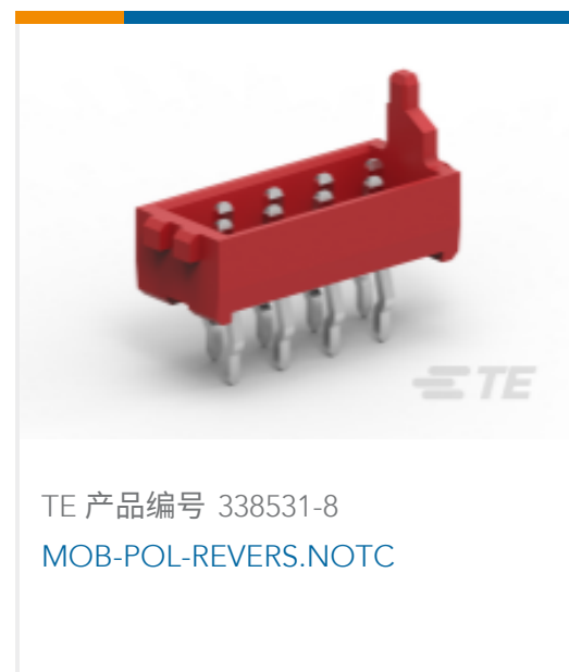
TE 产品编号 338531-8 MOB-POL-REVERS.NOTC