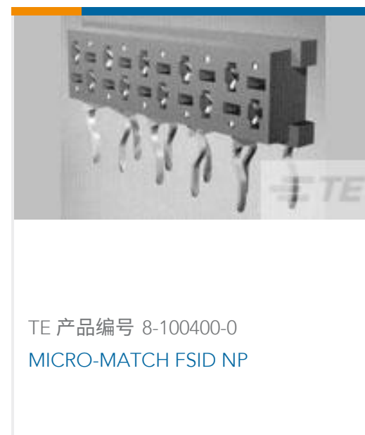
TE 产品编号 8-100400-0 MICRO-MATCH FSID NP