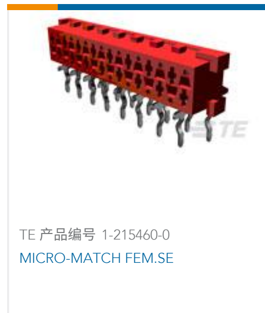
TE 产品编号 1-215460-0 MICRO-MATCH FEM.SE