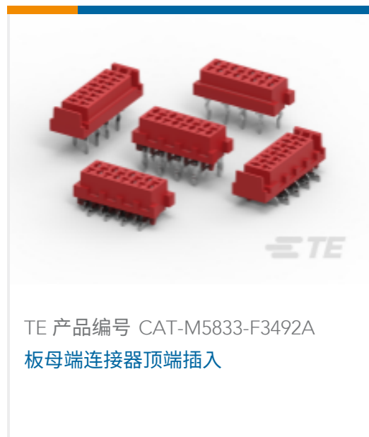
TE 产品编号 CAT-M5833-F3492A 板母端连接器顶端插入