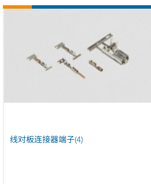
线对板连接器端子(4)