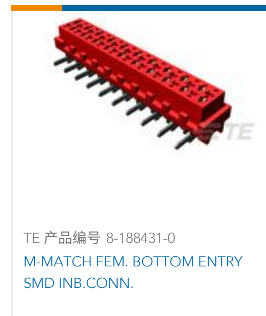
TE 产品编号 8-188431-0 M-MATCH FEM. BOTTOM ENTRY SMD INB.CONN.