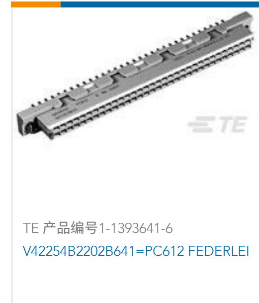
TE 产品编号1-1393641-6 V42254B2202B641=PC612 FEDERLEI