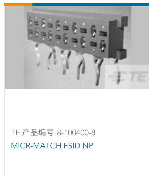
TE 产品编号 8-100400-8 MICR-MATCH FSID NP