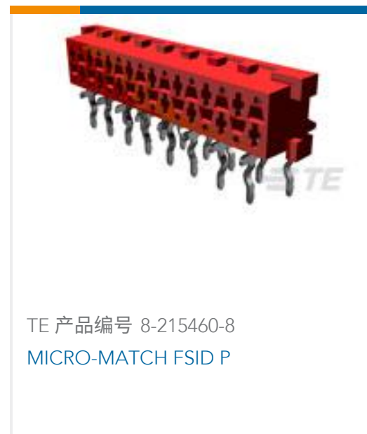
TE 产品编号 8-215460-8 MICRO-MATCH FSID P