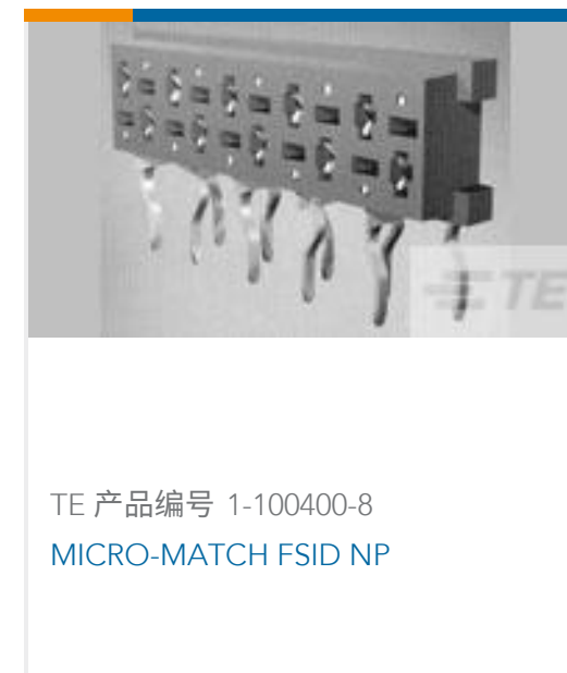
TE 产品编号 1-100400-8 MICRO-MATCH FSID NP