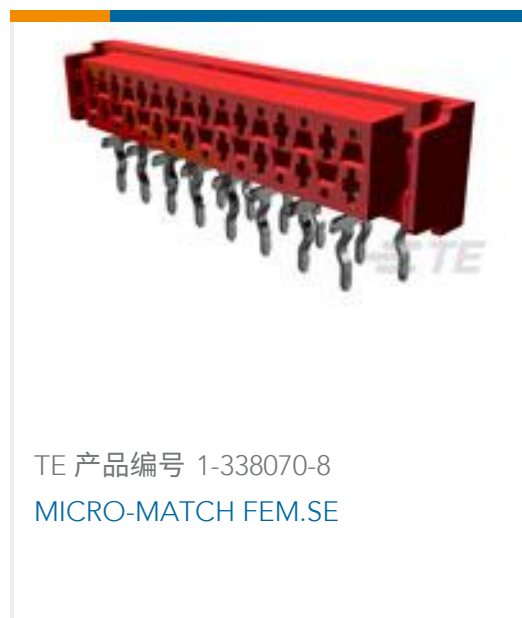
TE 产品编号 1-338070-8 MICRO-MATCH FEM.SE