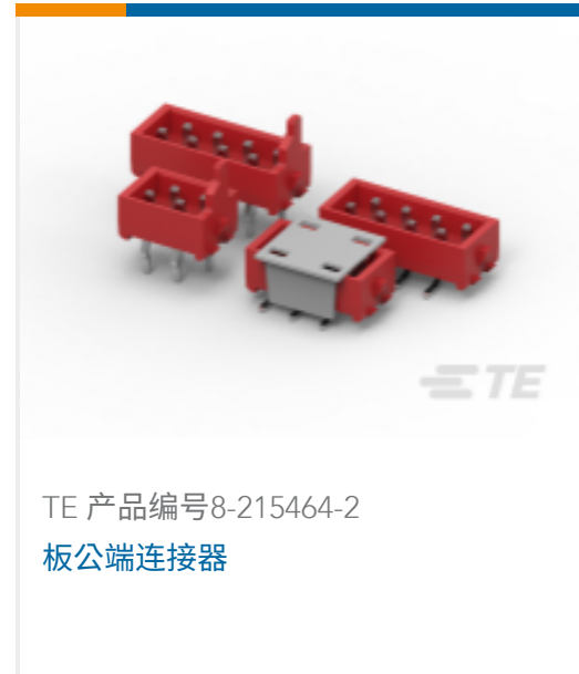
TE 产品编号8-215464-2 板公端连接器