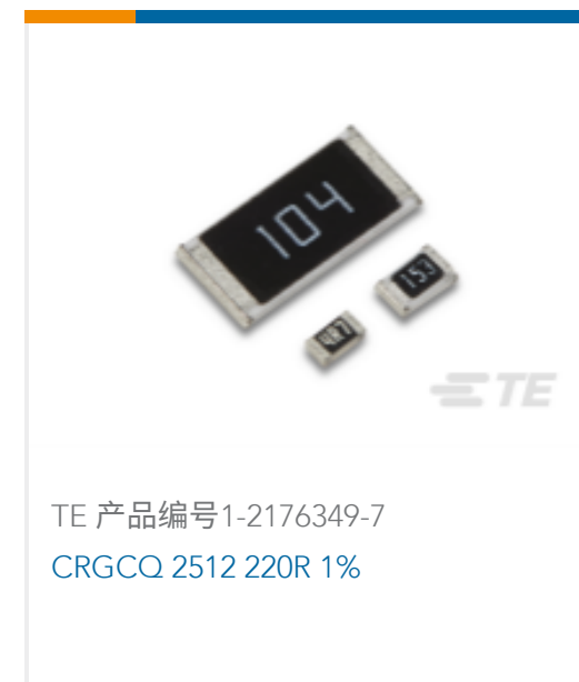
TE 产品编号1-2176349-7 CRGCQ 2512 220R 1%