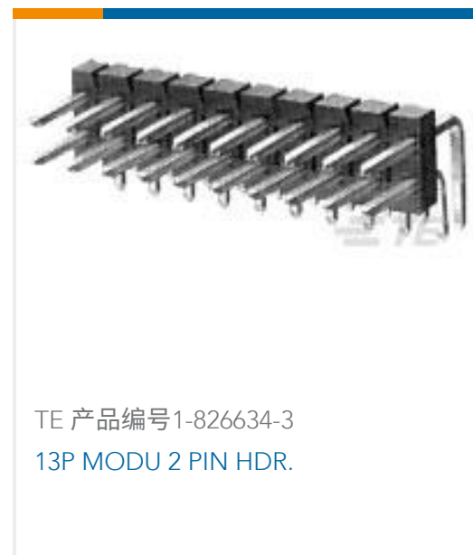
TE 产品编号1-826634-3 13P MODU 2 PIN HDR.