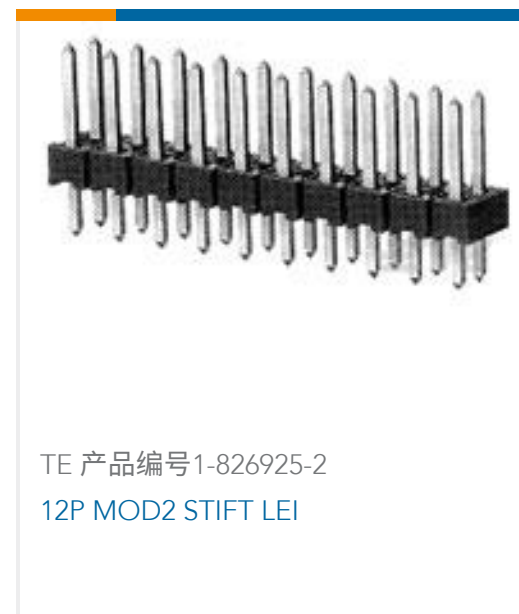
TE 产品编号1-826925-2 12P MOD2 STIFT LEI