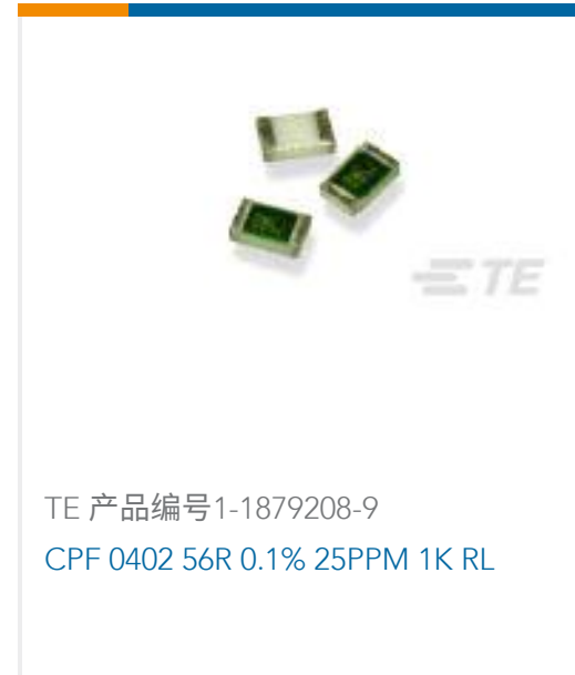
TE 产品编号1-1879208-9 CPF 0402 56R 0.1% 25PPM 1K RL