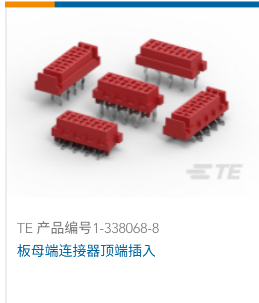
TE 产品编号1-338068-8 板母端连接器顶端插入