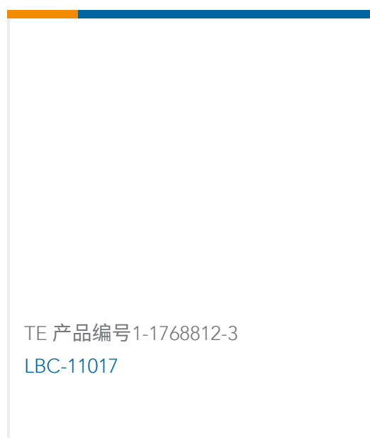
TE 产品编号1-1768812-3 LBC-11017