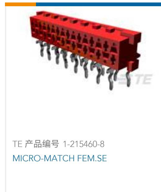
TE 产品编号 1-215460-8 MICRO-MATCH FEM.SE