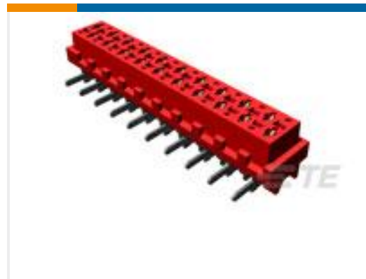
TE 产品编号 8-188431-4 M-MATCH FEM. BOTTOM ENTRY SMD INB.CONN.