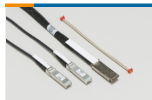
插拔式 I/O 电缆部件(52)