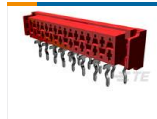
TE 产品编号 1-338070-4 MICRO-MATCH FEM.SE