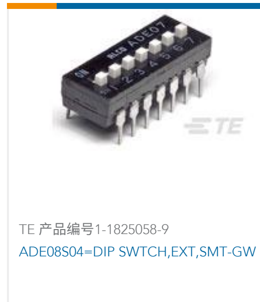
TE 产品编号1-1825058-9 ADE08S04=DIP SWTCH,EXT,SMT-GW