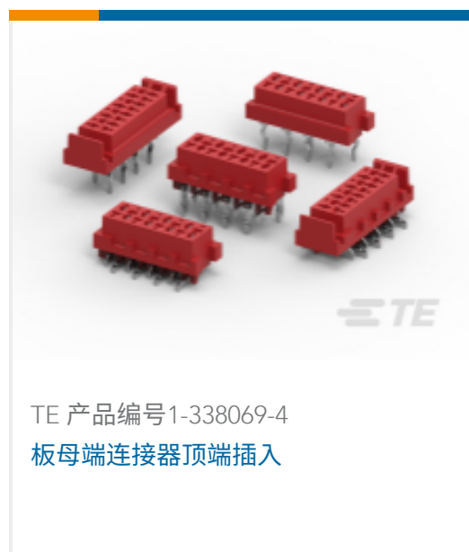
TE 产品编号1-338069-4 板母端连接器顶端插入