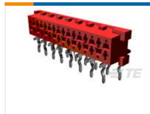
TE 产品编号 8-215460-4 MICR-MATCH FSID P