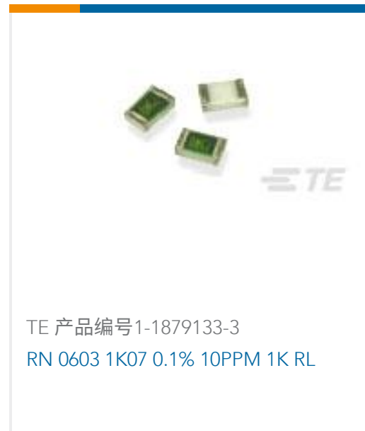
TE 产品编号1-1879133-3 RN 0603 1K07 0.1% 10PPM 1K RL