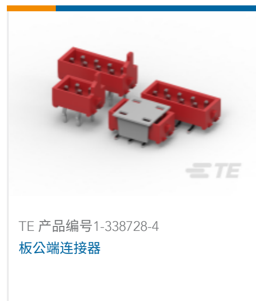
TE 产品编号1-338728-4 板公端连接器