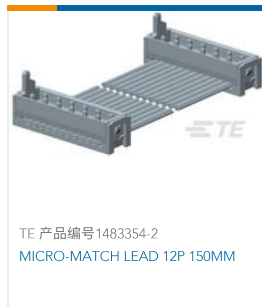
TE 产品编号1483354-2 MICRO-MATCH LEAD 12P 150MM