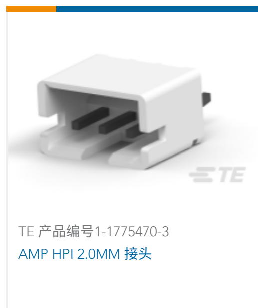
TE 产品编号1-1775470-3 AMP HPI 2.0MM 接头