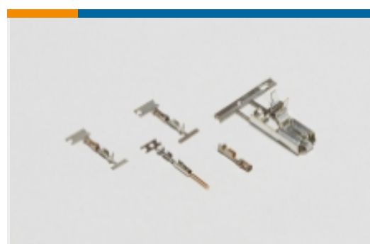
线对板连接器端子(4)