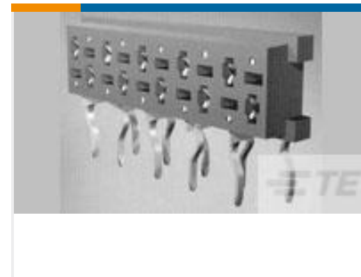
TE 产品编号 8-100400-4 MICRO-MATCH FSID NP