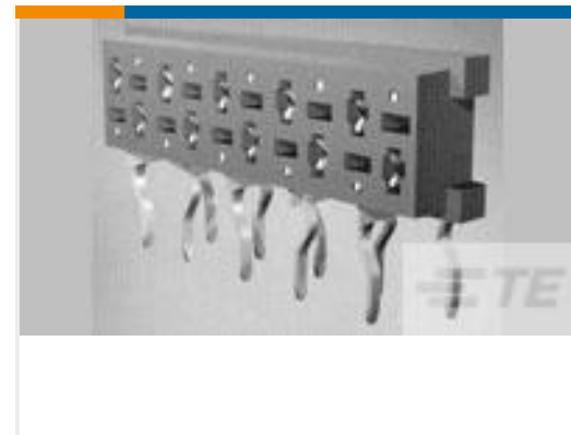
TE 产品编号 1-100400-4 MICRO-MATCH FSID NP