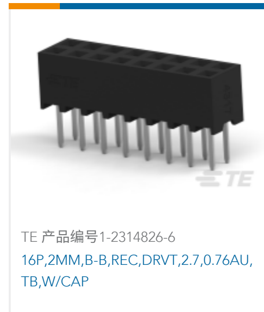
TE 产品编号1-2314826-6 16P,2MM,B-B,REC,DRV,2.7,0.76AU, TB,W/CAP