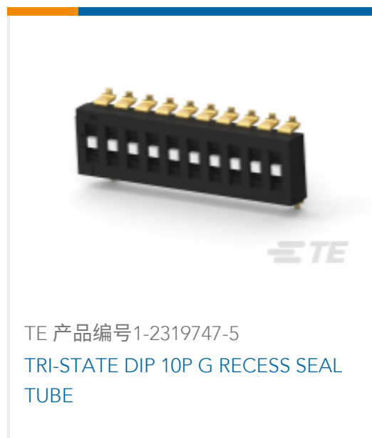
TE 产品编号1-2319747-5 TRI-STATE DIP 10P G RECESS SEAL TUBE