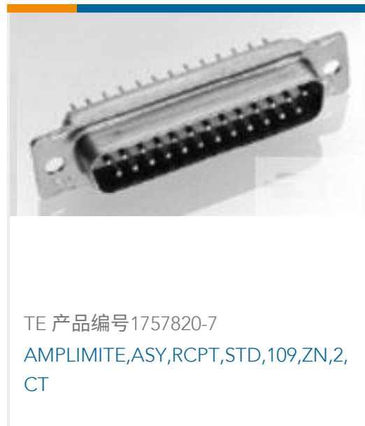
TE 产品编号1757820-7 AMPLIMITE,ASY,RCPT,STD,109,ZN,2,CT