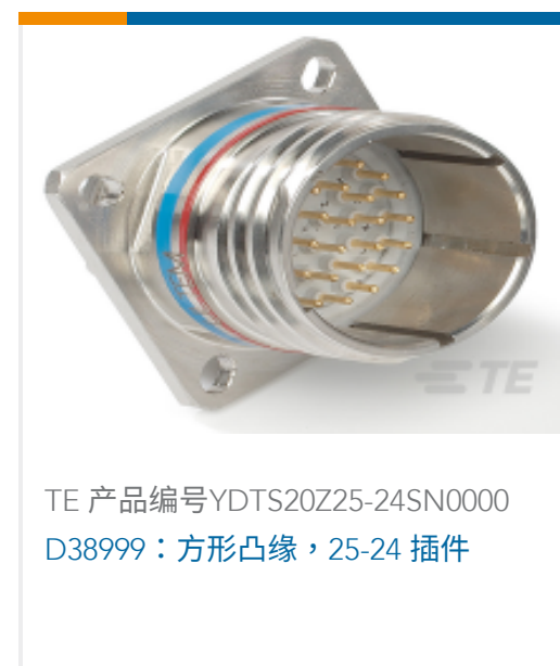
TE 产品编号YDTS20Z25-24SN0000 D38999：方形凸缘，25-24 插件