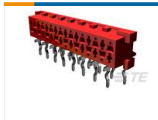
TE 产品编号 1-215460-4 MICRO-MATCH FEM.SE