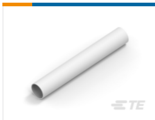
TE 产品编号NB19112001 RNF-100-1/4-WH-STK