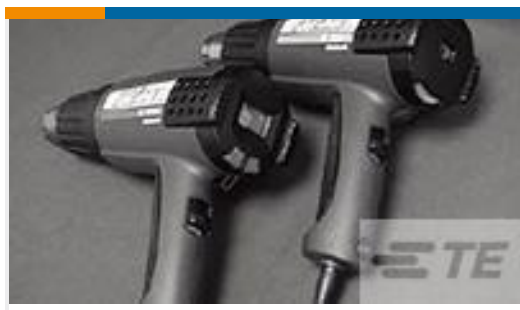
TE 产品编号 CJ2087-000 HL2010E-KIT-120V