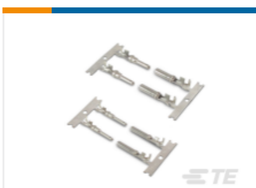
TE 产品编号1062-12-0222 DEUTSCH 冲压成型端子