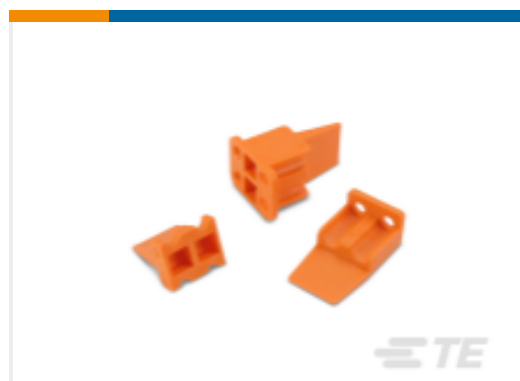
TE 产品编号WP-4S DEUTSCH DTP 楔形锁紧装置