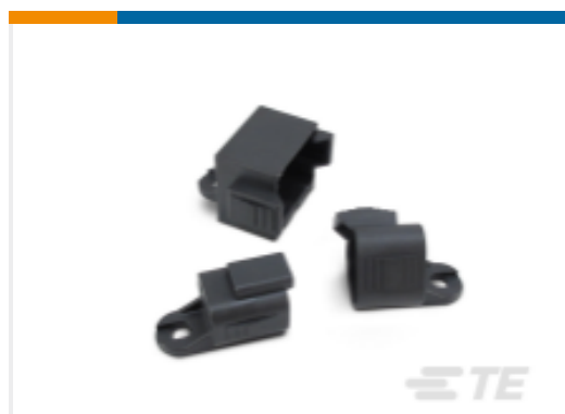
TE 产品编号1011-346-0405 DEUTSCH DT 防尘帽