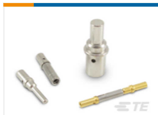
TE 产品编号0460-204-12141 DEUTSCH 实芯端子