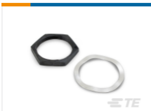
TE 产品编号2411-001-2405 DEUTSCH HDP20 安装硬件