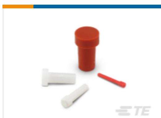
TE 产品编号114017-ZZ DEUTSCH 密封盲堵