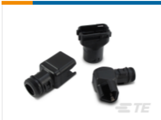
TE 产品编号1011-232-0305 DEUTSCH DT 后盖