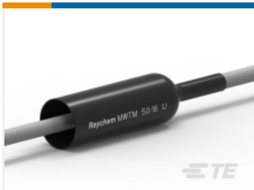
TE 产品编号834936-000 中厚壁热缩管