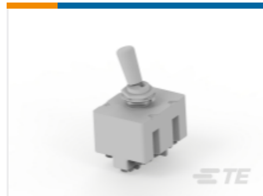
TE 产品编号K1002956 Toggle Switch 08-4-1-13