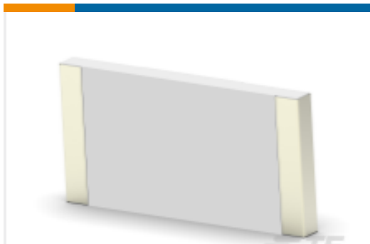
TE 产品编号2-2176246-3 CRGS2512 5% 68R