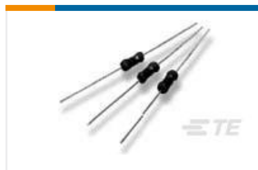
TE 产品编号2-1879354-5 RR03 5% 3R3 AMMO