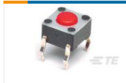
TE 产品编号3-1825910-2 FSM16JAH=6MM TACT SWITCH, HIGH TEMP