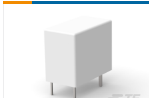
TE 产品编号1461404-1 STD OEG 小型 PCB OJ/OJE Pow 继电器