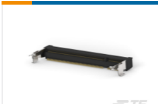
TE 产品编号1565917-4 DDR2 SO DIMM 插槽