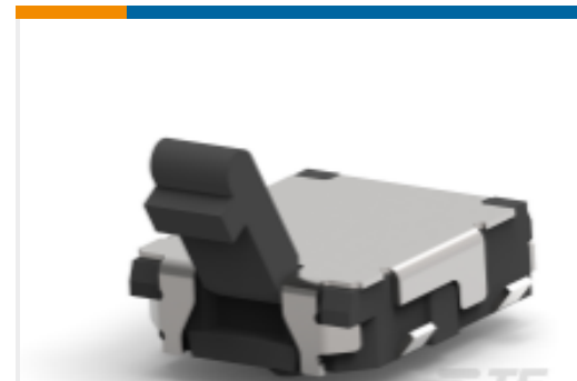
TE 产品编号2331389-1 DET SW4.2X3.6X1.2 JB VERT.(DW) NC AG RL