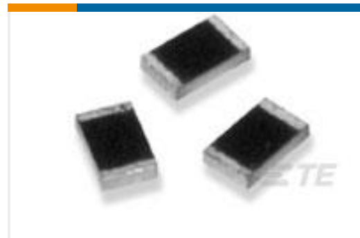
TE 产品编号1625867-5 RP 1J 0.166W 2K21 0.1% 25PPM 1K RL