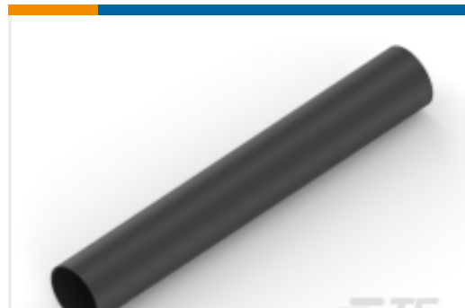
TE 产品编号NB11242001 ATUM-40/13-0-STK