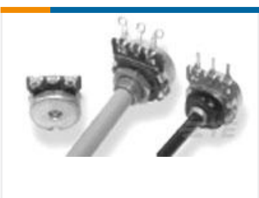
TE 产品编号1624157-2 23E 220KB 6.35X50FL B7 CAT