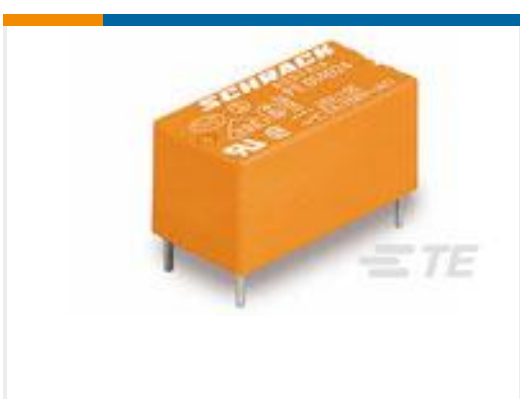
TE 产品编号1393219-6 PE014012