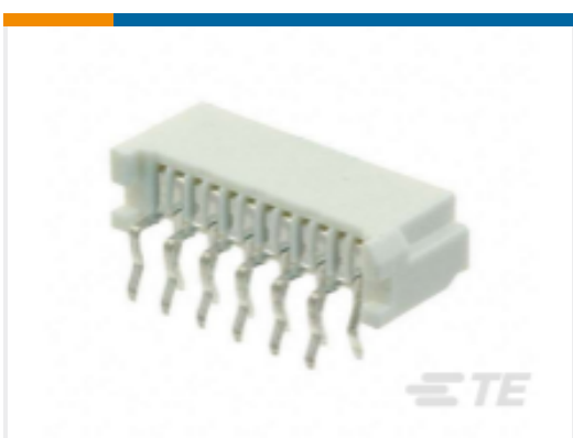
TE 产品编号1-84534-4 1.25mm FPC 连接器