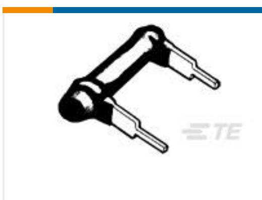
TE 产品编号1-1623714-2 FCB4 220R 5% HP