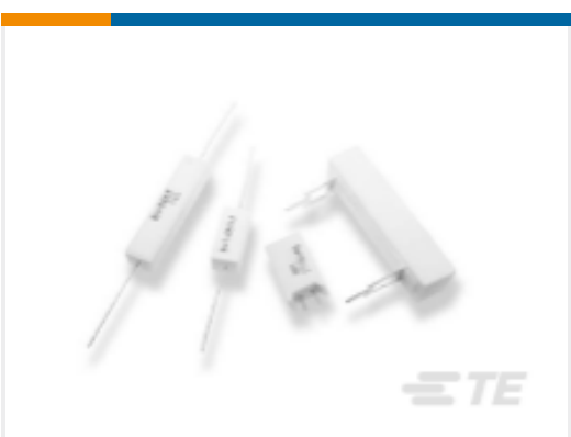
TE 产品编号1-1879068-0 线绕电阻器：水平安装