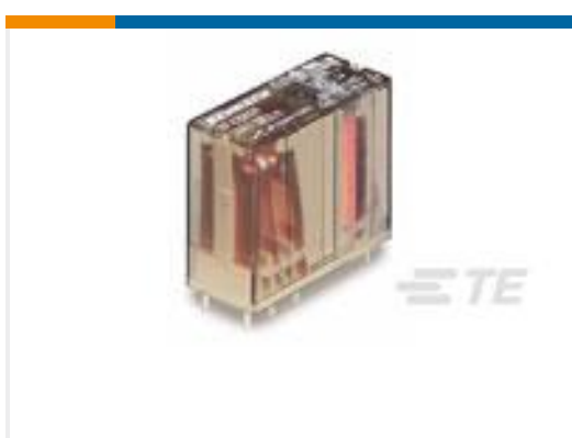
TE 产品编号1393845-5 RP821024