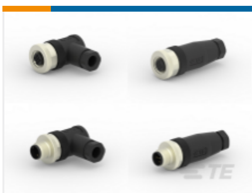
TE 产品编号T4110001051-000 M12 可现场安装非屏蔽式