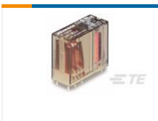
TE 产品编号1393845-4 RP821012