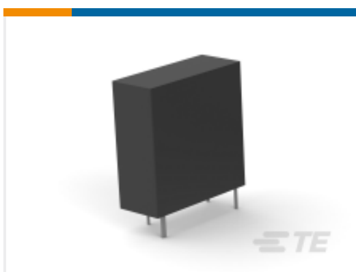
TE 产品编号1-1419126-8 STD OEG PCB PCFN 太阳能继电器