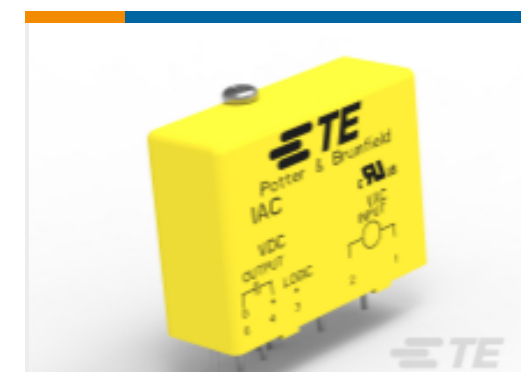
TE 产品编号1393028-4 SSR: PCB 安装、超薄继电器