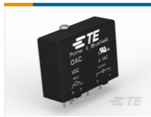
TE 产品编号 2319263-2 OUTPUT AC MODULE, 5A,240V AC -5 VDC IP