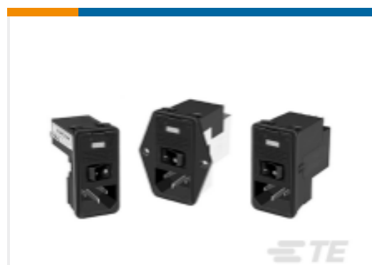
TE 产品编号8-6609940-7 CORCOM P 系列多功能插口式滤波器