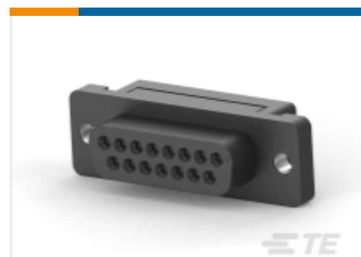
TE 产品编号1658610-2 IDC D-Sub: Receptacle Assembly, Low Profile, Signal, 2.77 mm