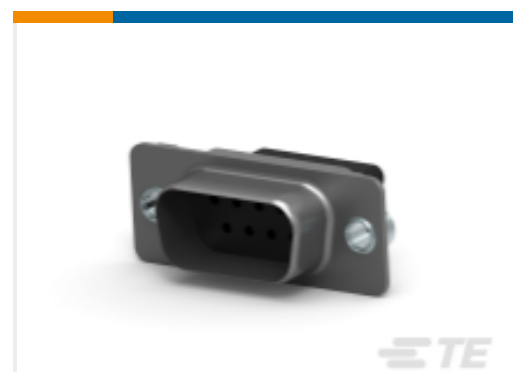
TE 产品编号1658655-1 D-Sub Crimp: Plug, Signal, 9 Posn, Pin Size 20, Shell Size 1