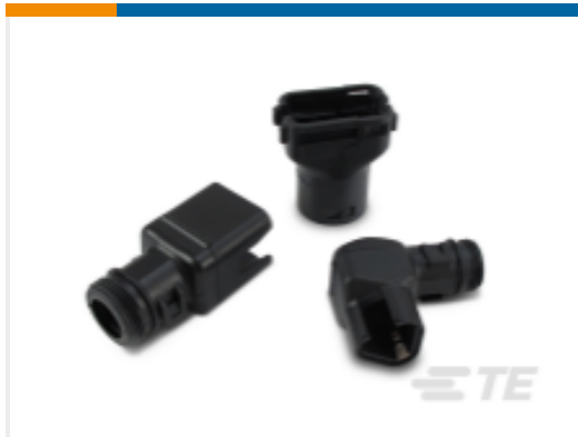
TE 产品编号1011-232-0305 DEUTSCH DT 后盖