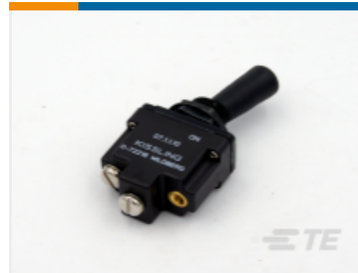
TE 产品编号K1007153 Toggle Switch 1-Pole, Sealed, Lever, Toggle, Plastic Lever