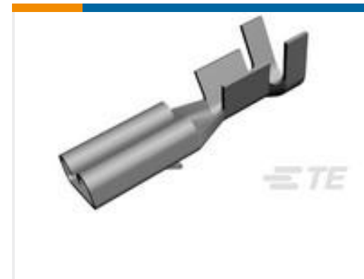
TE 产品编号160668-6 TERMINAL