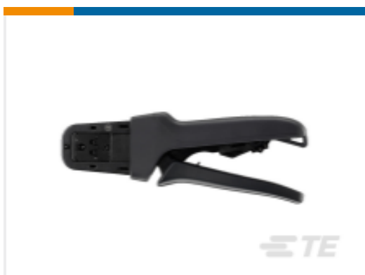
TE 产品编号DTT-20-03 CRIMP TOOL