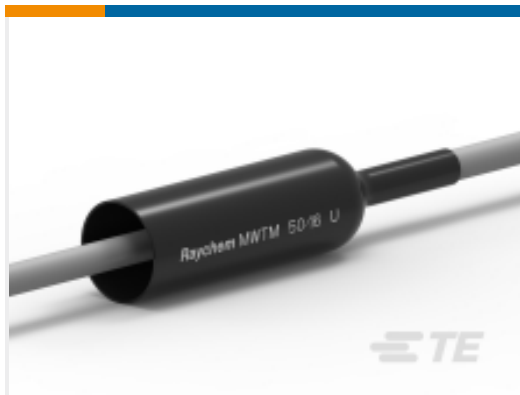
TE 产品编号834936-000 中厚壁热缩管