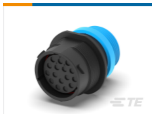
TE 产品编号HDP24-24-16SE-L015 REC, 16P, BLK, E, THD, 12, S