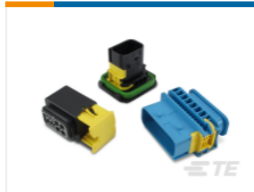
TE 产品编号2-1564532-1 重载密封连接器壳体