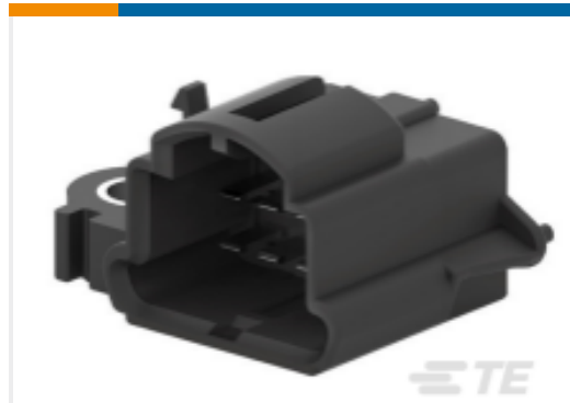
TE 产品编号1-963224-1 低和中等功率接头