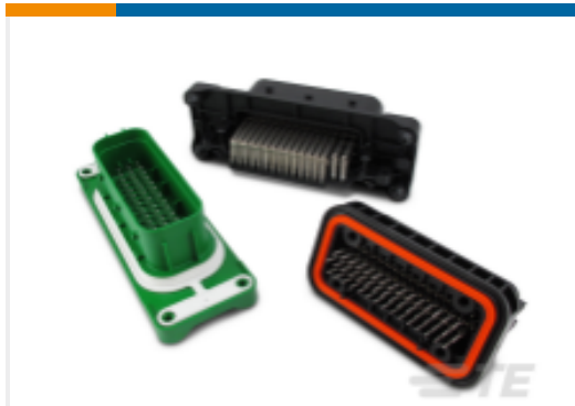
TE 产品编号1-1452228-9 LEAVYSEAL 接头