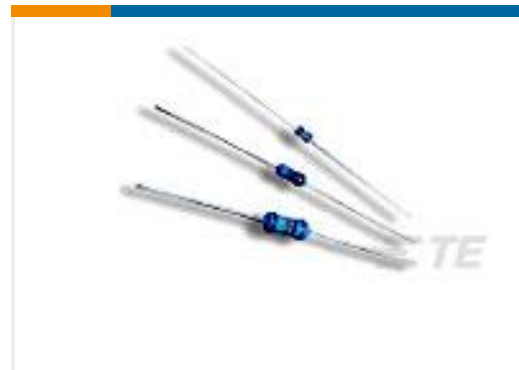
TE 产品编号1-1622796-5 YR1 0.1% 200K