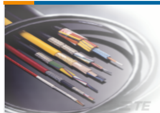
TE 产品编号F626423001 100G1121-0.50-0/9-0CK0226