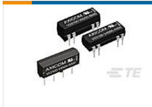
TE 产品编号1-1393763-0 V23100V4015A000