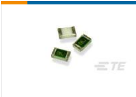
TE 产品编号1-1614884-5 CPF 0805 8R2 0.1% 25PPM 1K RL