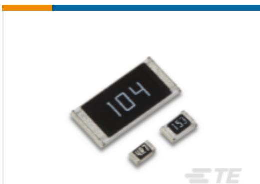
TE 产品编号1-2176345-2 CRGCQ 1210 82R 1%