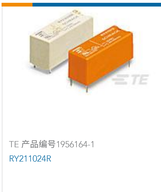
TE 产品编号1956164-1 RY211024R