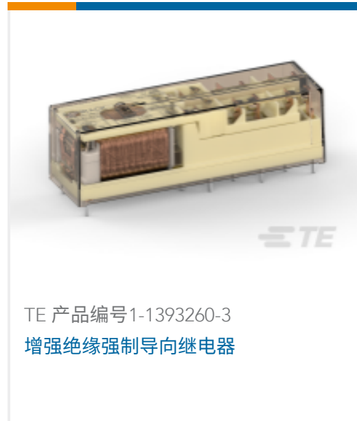
TE 产品编号1-1393260-3 增强绝缘强制导向继电器