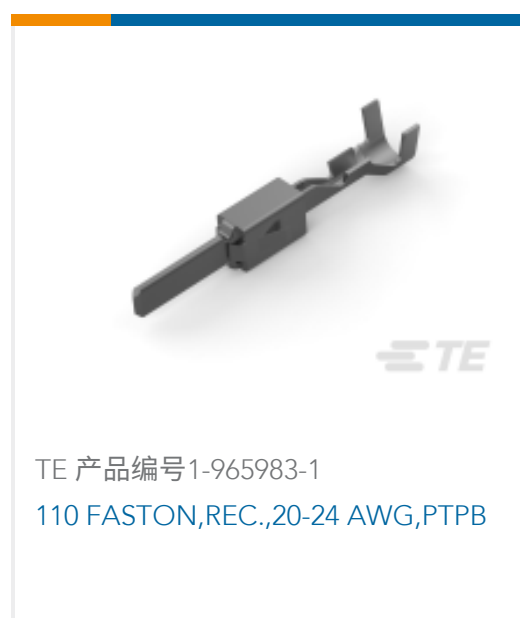
TE 产品编号1-965983-1 110 FASTON,REC.,20-24 AWG,PTPB