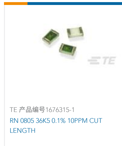
TE 产品编号1676315-1 RN 0805 36K5 0.1% 10PPM CUT LENGTH