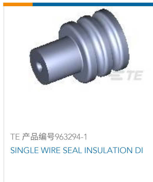
TE 产品编号963294-1 SINGLE WIRE SEAL INSULATION DI