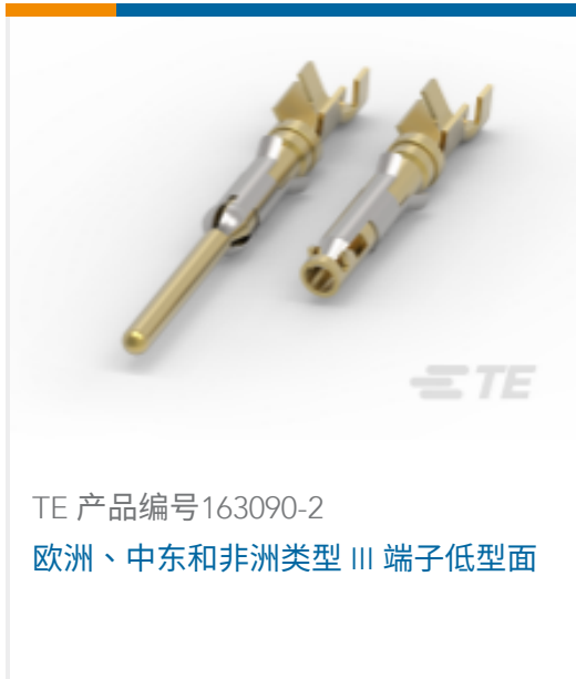
TE 产品编号163090-2 欧洲、中东和非洲类型 III 端子低型面