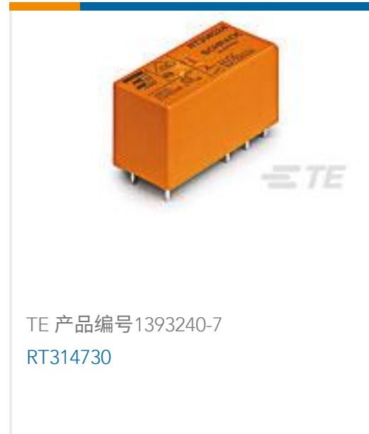
TE 产品编号1393240-7 RT314730