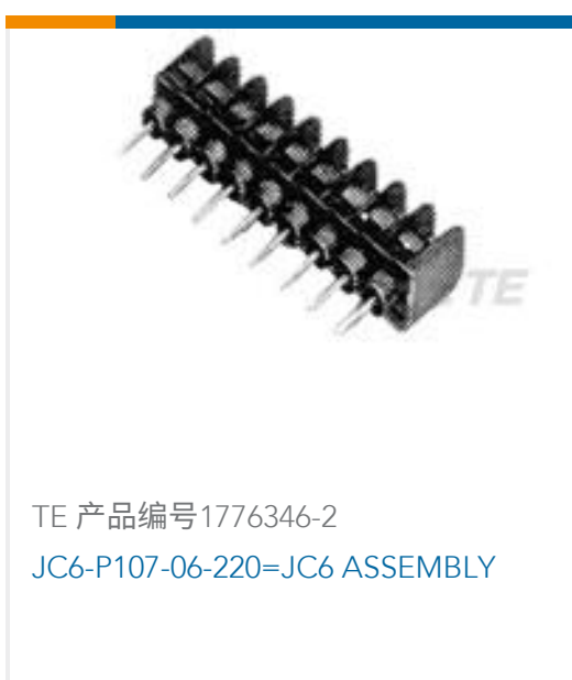
TE 产品编号1776346-2 JC6-P107-06-220=JC6 ASSEMBLY