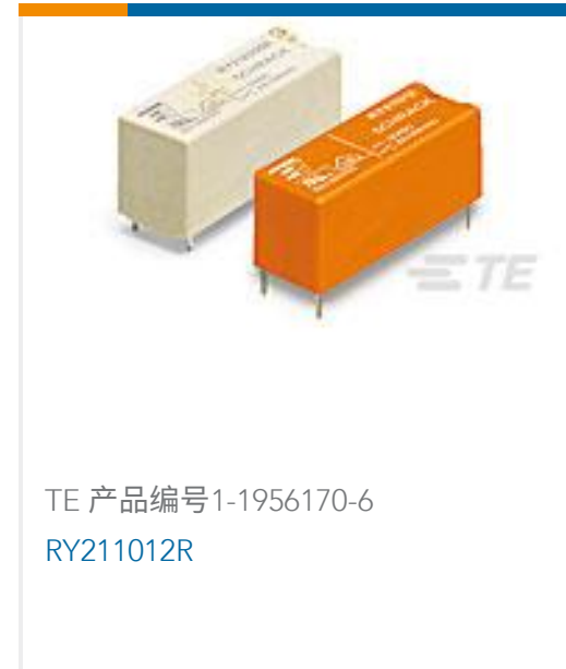
TE 产品编号1-1956170-6 RY211012R