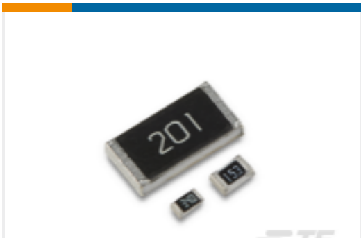
TE 产品编号1-2176329-0 CRGP 1210 56R 1%