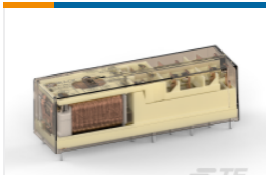
TE 产品编号1393260-5 增强绝缘强制导向继电器