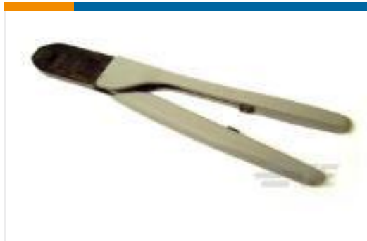
TE 产品编号91521-1 CCII TYPE III+ PIN SKT 18-14 ASSY