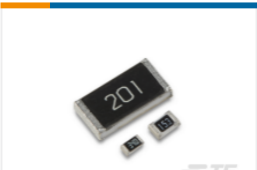
TE 产品编号1-2176329-2 CRGP 1210 82R 1%