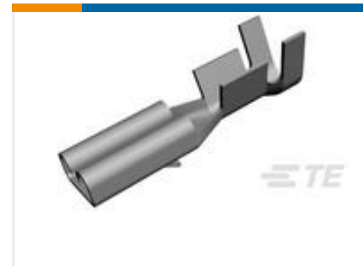
TE 产品编号160668-6 TERMINAL