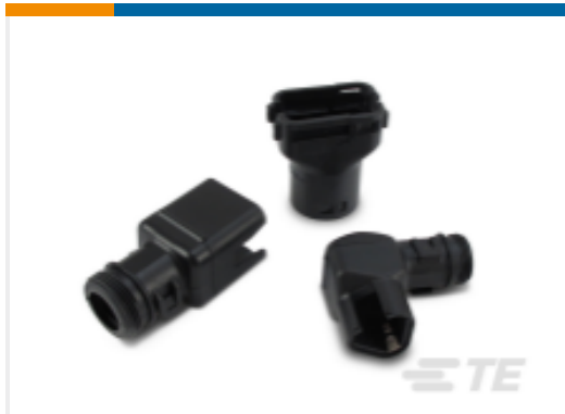
TE 产品编号1011-232-0305 DEUTSCH DT 后盖