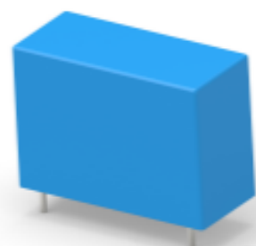
TE 产品编号 CAT-OE4-OM5 STD OEG 小型 PCB OJT 功率继电器