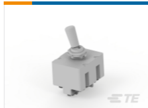
TE 产品编号K1002956 Toggle Switch 08-4-1-13