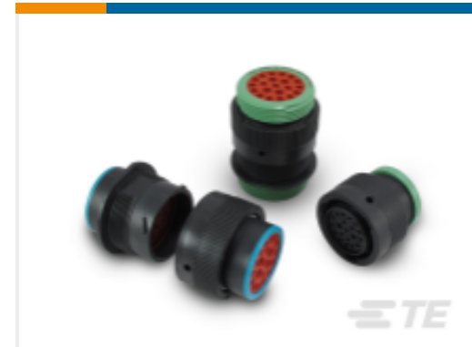
TE 产品编号YHDP26-24-35PEL017 DEUTSCH HDP20 壳体