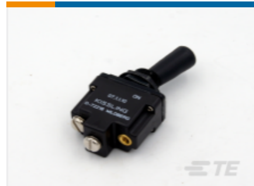
TE 产品编号K1007153 Toggle Switch 1-Pole, Sealed, Lever, Toggle, Plastic Lever