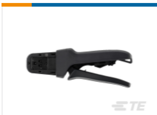
TE 产品编号DTT-20-03 CRIMP TOOL