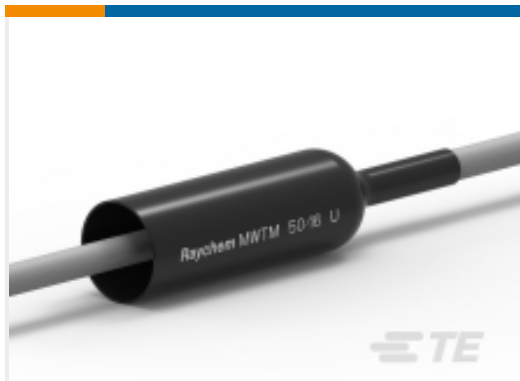
TE 产品编号834936-000 中厚壁热缩管