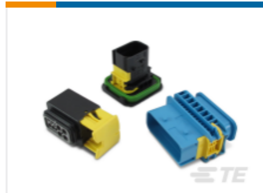
TE 产品编号2-1564532-1 重载密封连接器壳体