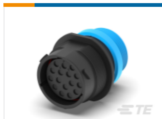
TE 产品编号HDP24-24-16SE-L015 REC, 16P, BLK, E, THD, 12, S