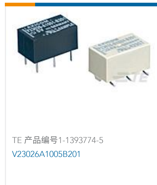
TE 产品编号1-1393774-5 V23026A1005B201