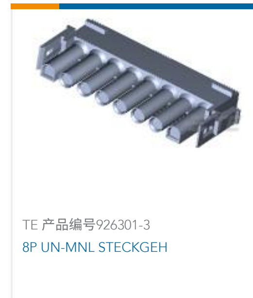
TE 产品编号926301-3 8P UN-MNL STECKGEH