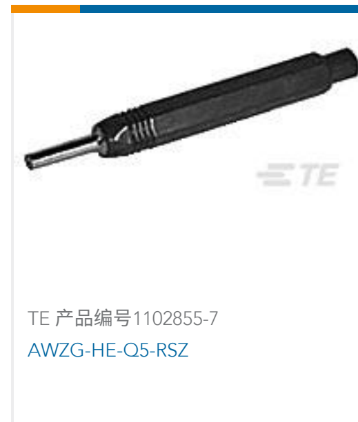
TE 产品编号1102855-7 AWZG-HE-Q5-RSZ