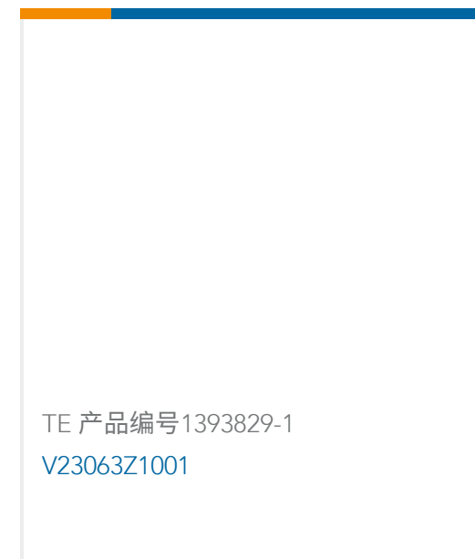
TE 产品编号1393829-1 V23063Z1001