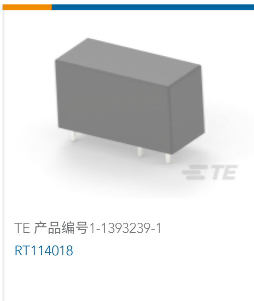
TE 产品编号1-1393239-1 RT114018