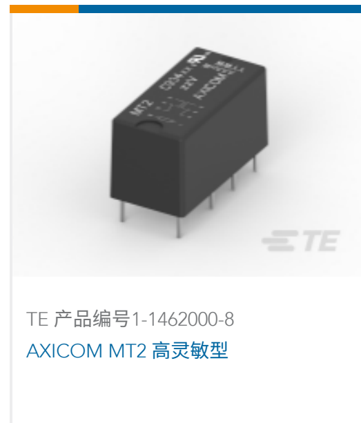
TE 产品编号1-1462000-8 AXICOM MT2 高灵敏度