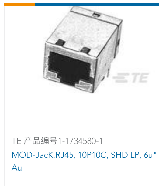
TE 产品编号1-1734580-1 MOD-Jack,RJ45, 10P10C, SHD LP, 6u" Au