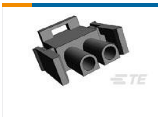
TE 产品编号1-480698-0 02P UMNL PLUG HSG NATL