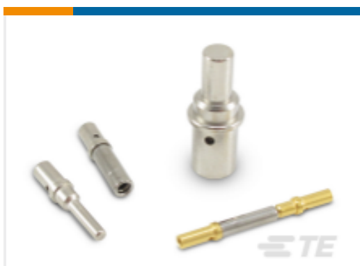
TE 产品编号0462-201-20141 DEUTSCH 实芯端子