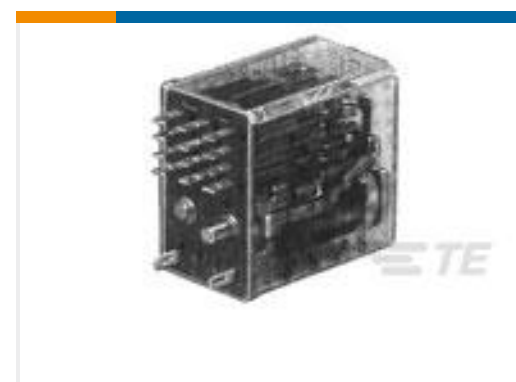
TE 产品编号1-1393766-2 R10-E1X4-S450=R10