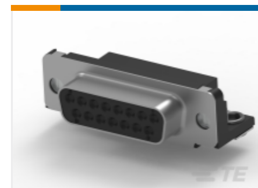
TE 产品编号106506-2 D-Sub Receptacle Assembly: Right Angle, Shell Size 2, 2.74mm