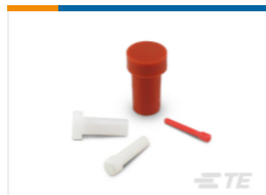
TE 产品编号114017-ZZ DEUTSCH 密封盲堵