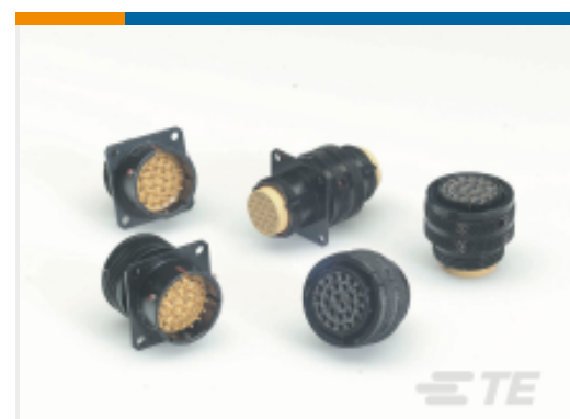
TE 产品编号ZPF000000000019485 FDPA 56-18-32 SX-K 090