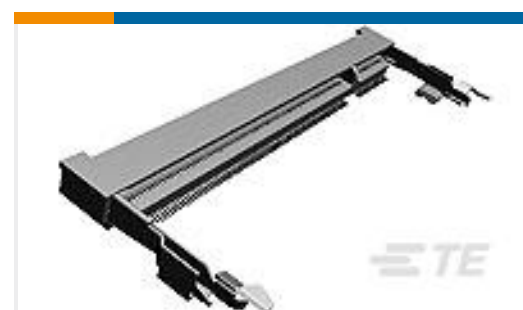
TE 产品编号1871232-4 DDR2 H5.2 STD DIRECT PEG TRAY ASS'Y