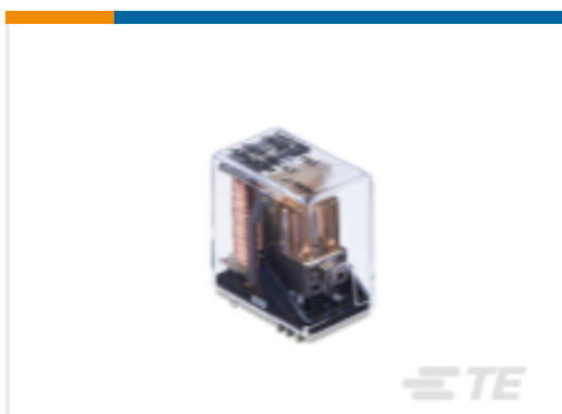
TE 产品编号1393809-1 信号继电器：5 安培，单稳直流