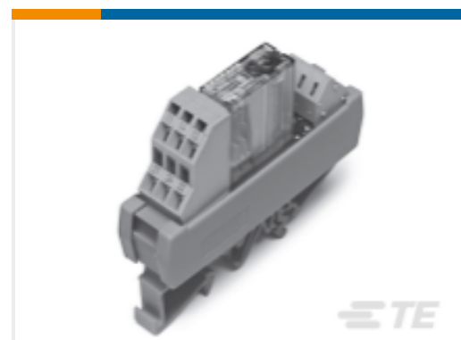
TE 产品编号1415060-1 DIN 导轨强制导向功率继电器