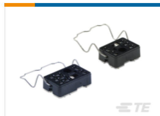
TE 产品编号1393827-2 CRADLE 继电器附件