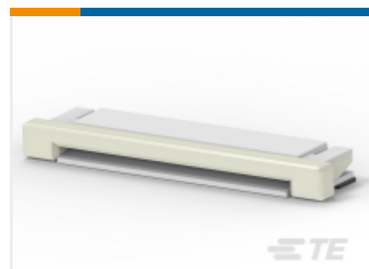
TE 产品编号2-1775333-6 .5mm FPC 连接器