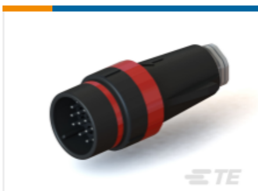
TE 产品编号ZPF00000000112132 UIC558 插头 - 公端 - 13 或 18 插针