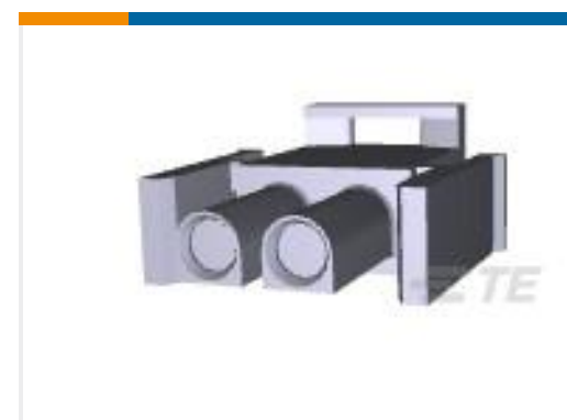
TE 产品编号1-350777-6 02P UMNL V0 PLUG HSG BLUE