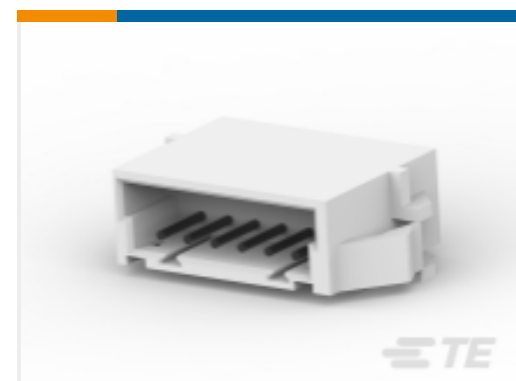
TE 产品编号2-292254-8 CT 继电器公端：线到面板