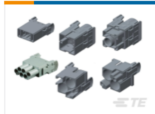
TE 产品编号T2111092201-007 HDC HMN - 符合铁路标准的模块化系统