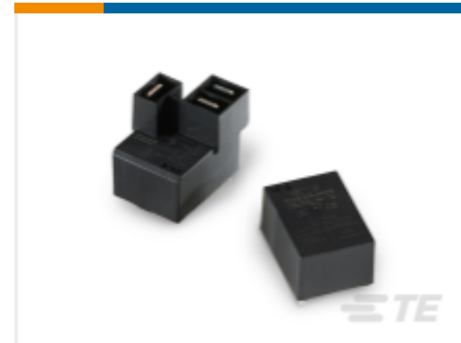
TE 产品编号1558662-4 PCB 功率继电器：30 安培，单稳直流系统