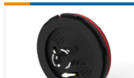
TE 产品编号1-2336396-1 ASSEMBLY, LIGHT CONTROLLER BASE, W/VENT