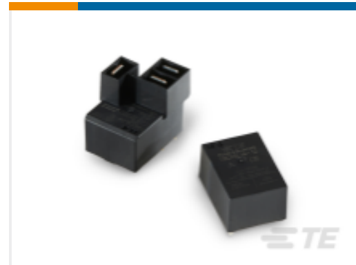
TE 产品编号1558662-4 PCB 功率继电器：30 安培，单稳直流系统