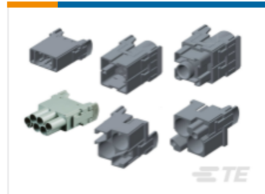
TE 产品编号T2111092201-007 HDC HMN - 符合铁路标准的模块化系统