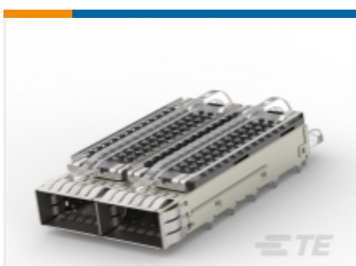
TE 产品编号2170808-1 QSFP28, 1X2, CAGE ASSY, SPRING, HS, LP