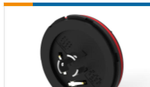
TE 产品编号1-2336396-1 ASSEMBLY, LIGHT CONTROLLER BASE, W/VENT