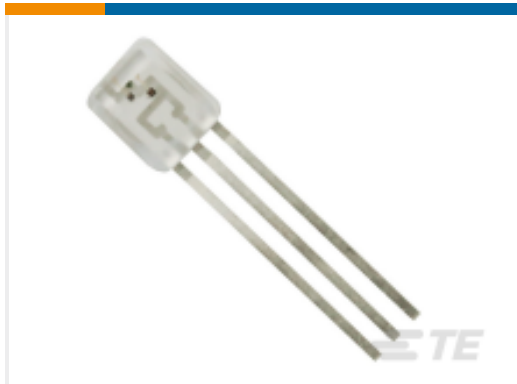
TE 产品编号11032254-00 光电发射器组件