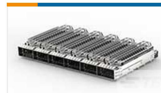
TE 产品编号2-2170708-1 CAGE ASSY, 1X6, QSFP28, SPRING, HS, LP