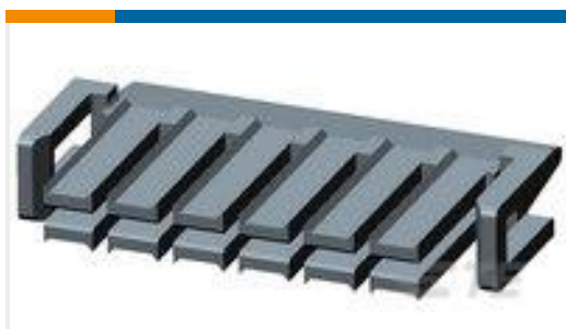
TE 产品编号2-1969541-8 RETAINER, TPA, DUAL ROW, EP2.5