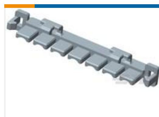
TE 产品编号1-1969609-2 12P VAL-U-LOK TPA 26-22 AWG