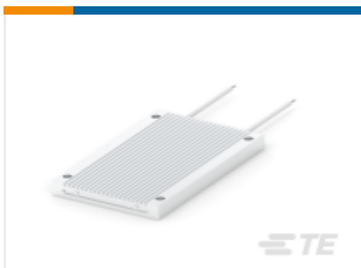
TE 产品编号1-2176250-4 TJT 500W 150R 5%