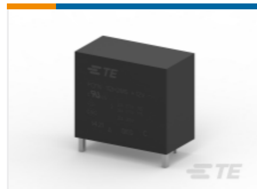
TE 产品编号9-1440003-2 PCFN 太阳能继电器