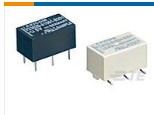
TE 产品编号1393774-1 V23026A1001B201