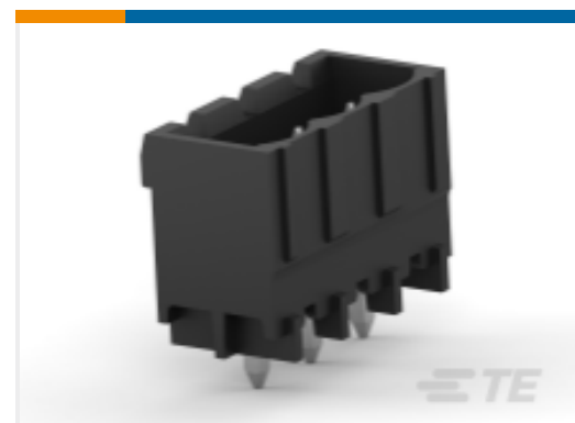
TE 产品编号1-2342082-5 15POS HDR ST, HT, 5.00MM PITCH, TL 2.6MM