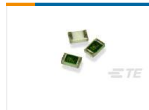
TE 产品编号1-1879338-6 CPF 0603 38K3 1% 50PPM 1K RL