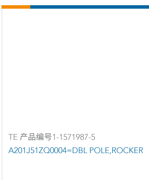
TE 产品编号1-1571987-5 A201J51ZQ0004=DBL POLE,ROCKER