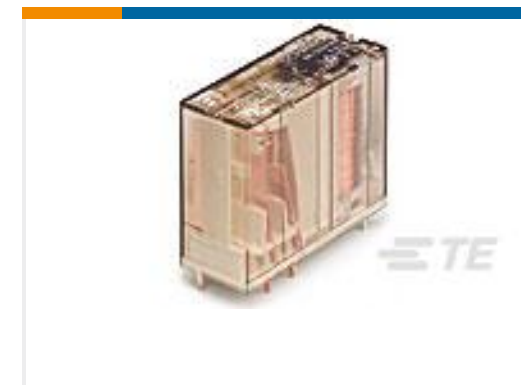
TE 产品编号1-1393258-7 V23047-A1024-A511