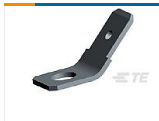
TE 产品编号140814-2 250 FASTON, TAB, TPBR