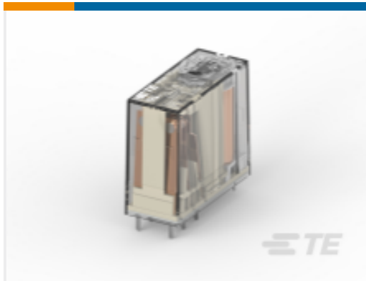
TE 产品编号1-1393258-5 2 极强制导向功率继电器