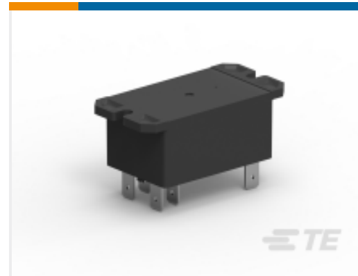
TE 产品编号1393212-8 PCB 功率继电器：40 Amp，单稳