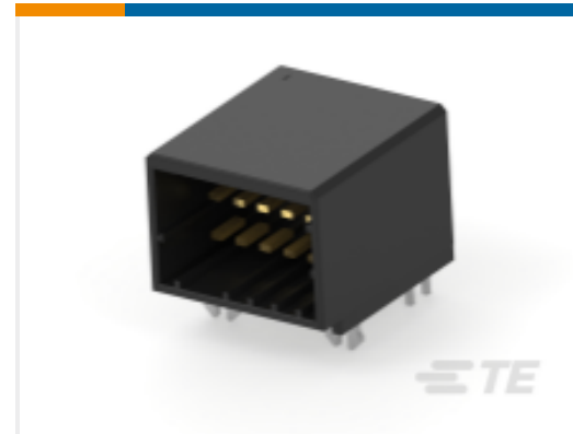
TE 产品编号1318127-1 Dynamic 2000 HDR 组件