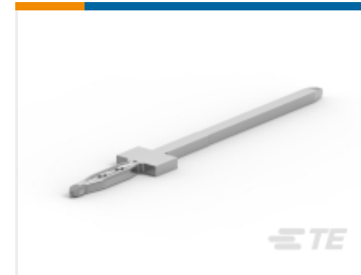
TE 产品编号1394353-2 免焊连接插针端子