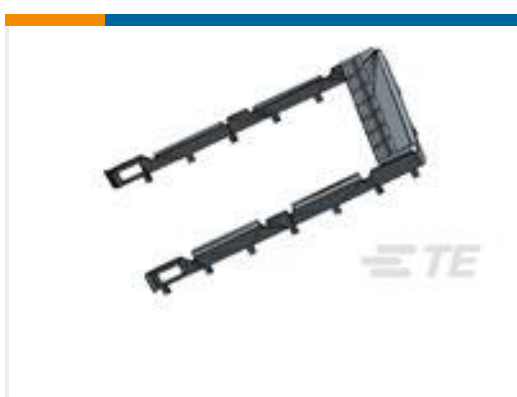
TE 产品编号1367610-1 RAIL ASSY, GUIDE X2, BEZEL MT