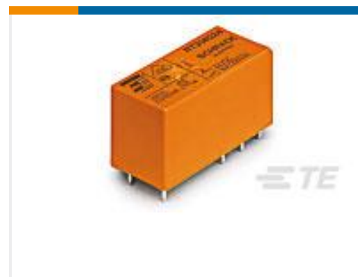
TE 产品编号1-1415537-7 RTD1L005