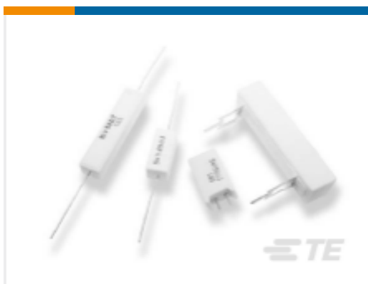
TE 产品编号1-1623783-3 线绕电阻器：垂直安装