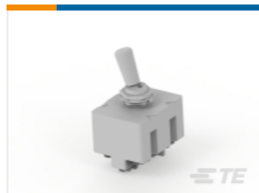
TE 产品编号K1002956 Toggle Switch 08-4-1-13