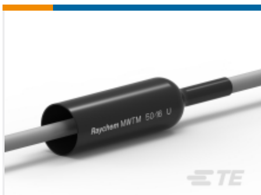
TE 产品编号834936-000 中厚壁热缩管