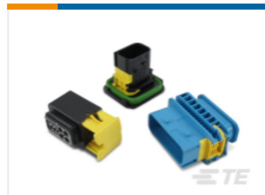
TE 产品编号2-1564532-1 重载密封连接器壳体