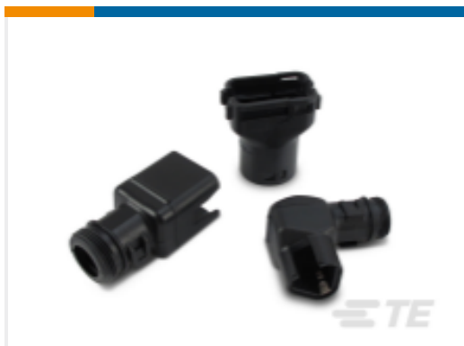
TE 产品编号1011-232-0305 DEUTSCH DT 后盖