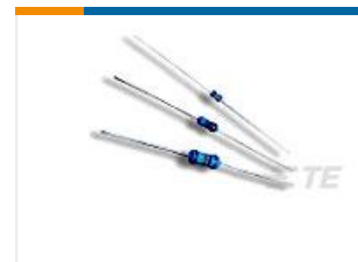
TE 产品编号1622740-1 LR2 1% 390K