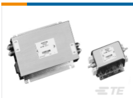
TE 产品编号6609074-5 CORCOM DC 系列直流滤波器