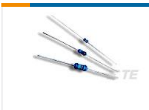
TE 产品编号1622752-1 LR2 1% 470K