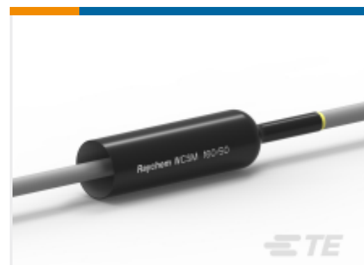
TE 产品编号CU9289-000 厚壁热缩管