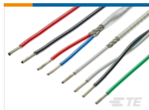
TE 产品编号3871353001 44A1111-20-2-9