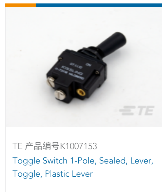
TE 产品编号K1007153 Toggle Switch 1-Pole, Sealed, Lever, Toggle, Plastic Lever