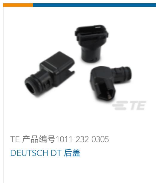
TE 产品编号1011-232-0305 DEUTSCH DT 后盖