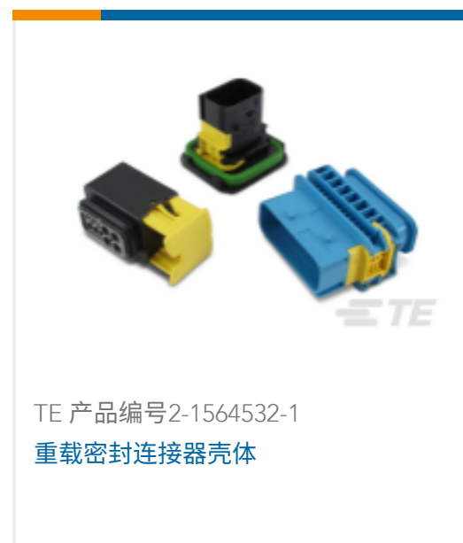
TE 产品编号2-1564532-1 重载密封连接器壳体