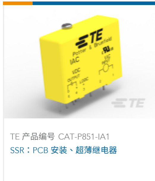
TE 产品编号 CAT-P851-IA1 SSR：PCB 安装、超薄继电器