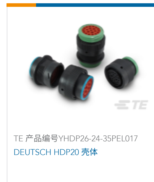
TE 产品编号YHDP26-24-35PEL017 DEUTSCH HDP20 壳体