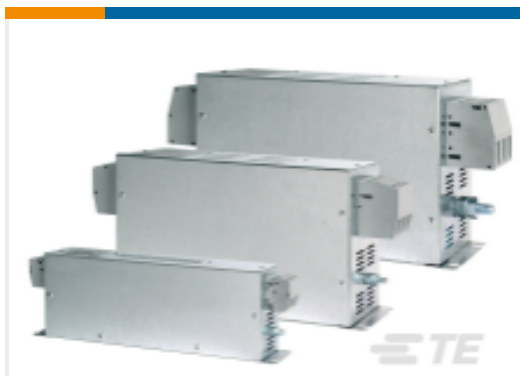
TE 产品编号1609989-3 CORCOM BCF 系列三相滤波器