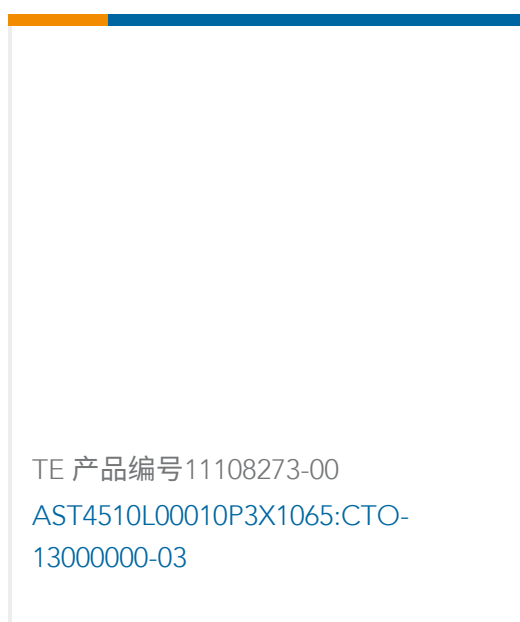
TE 产品编号11108273-00 AST4510L00010P3X1065:CTO-13000000-03