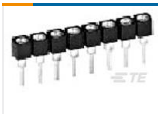
TE 产品编号1-1571994-0 510-AG91D-10LF SIP SOCKET ASSY