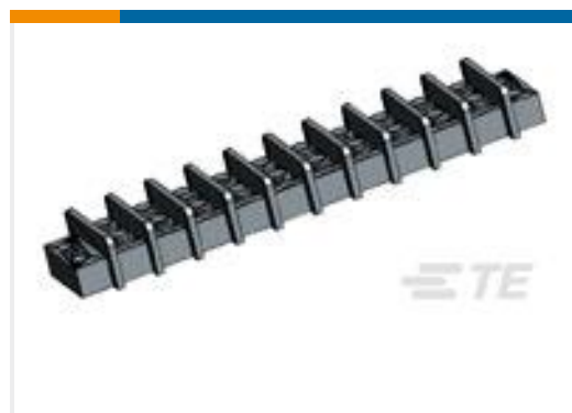
TE 产品编号1-1546670-0 10P.437" DR BARRIER,W/BND SCRW