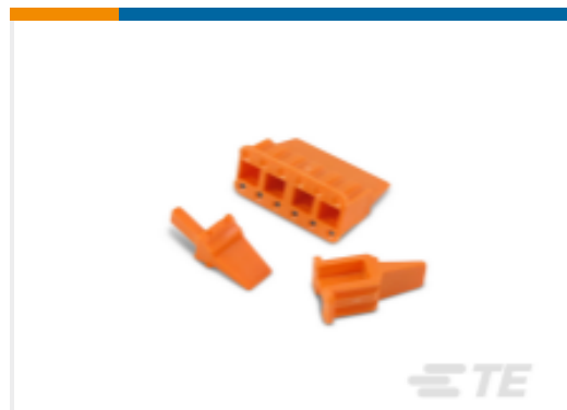
TE 产品编号WM-12P DEUTSCH DTM 楔形锁紧装置