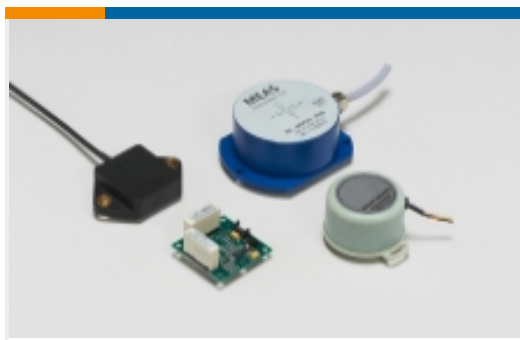
倾角传感器和倾角仪(6)