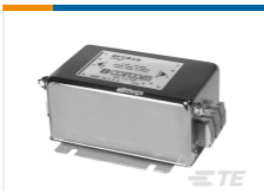
TE 产品编号1-6609974-1 CORCOM FCD 系列三相滤波器