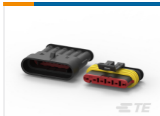
TE 产品编号282088-1 AMP SUPERSEAL 1.5MM, 连接器壳体