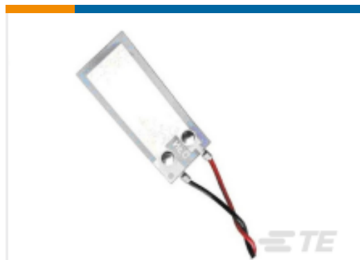
TE 产品编号11029805-00 带引线的压电薄膜传感器