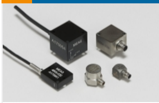
即插即用加速度传感器(18)