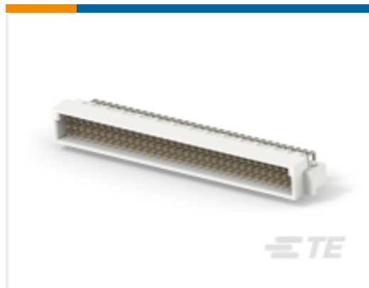
TE 产品编号6-2271013-0 CELLO,PIN,96P,TH,RA,FG,DIP4.0,-