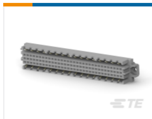
TE 产品编号5650992-5 ASSY,RECPT,ENH.TYPE C, EUROCARD,L-FREE,5