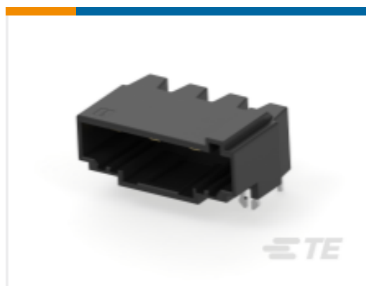
TE 产品编号3-2289080-1 Dynamic 3950 组件