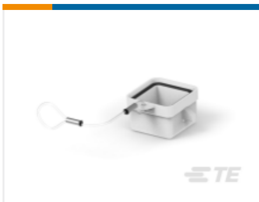
TE 产品编号T1009033100-000 H3A-KDBP