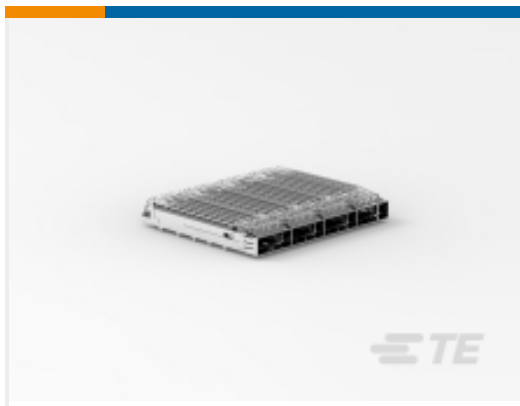
TE 产品编号4-2170747-4 CAGE ASSY, 1X4, QSFP28, SPRING, HS, LP