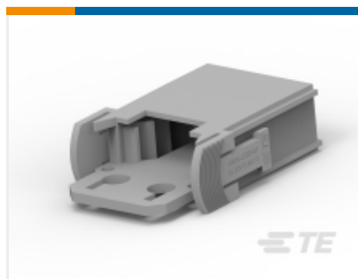
TE 产品编号T2114000101-000 HMN-USB-M