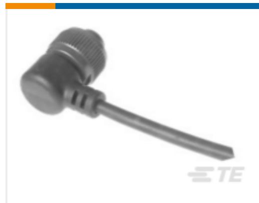
TE 产品编号318A-120 CABLE 318A