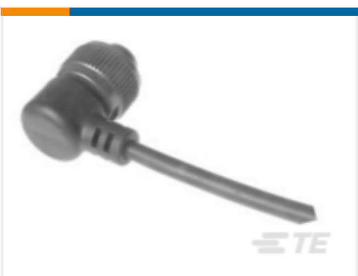
TE 产品编号318A-120 CABLE 318A