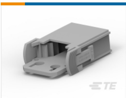
TE 产品编号T2114000101-000 HMN-USB-M