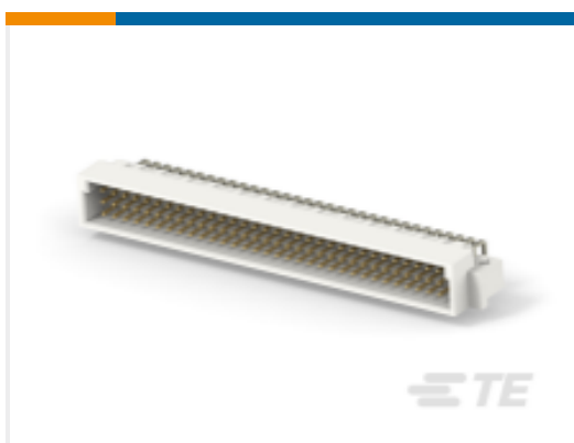
TE 产品编号6-2271013-0 CELLO,PIN,96P,TH,RA,FG,DIP4.0,-