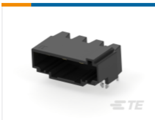
TE 产品编号3-2289080-1 Dynamic 3950 组件