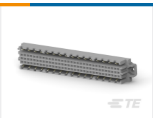
TE 产品编号5650992-5 ASSY,RECPT,ENH.TYPE C, EUROCARD,L-FREE,5