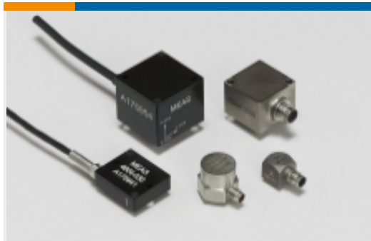
即插即用加速度传感器(18)