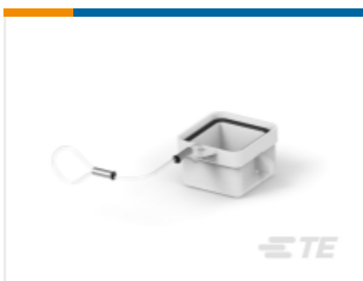
TE 产品编号T1009033100-000 H3A-KDBP