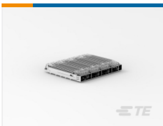
TE 产品编号4-2170747-4 CAGE ASSY, 1X4, QSFP28, SPRING, HS, LP