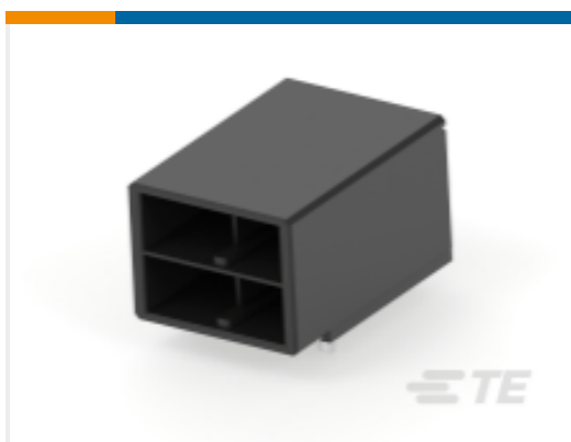
TE 产品编号3-1123829-1 Dynamic 5000 HDR 组件