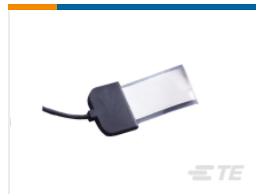
TE 产品编号 11031263-00 屏蔽同轴电缆压电传感器