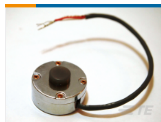
TE 产品编号 1007079-1 CONTACT MICROPHONE CM-01