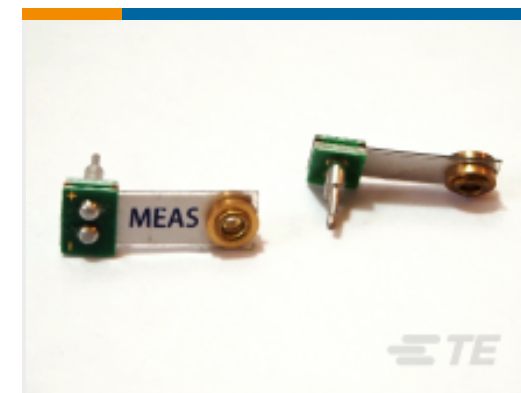
TE 产品编号 1005939-1 高灵敏度加速度传感器