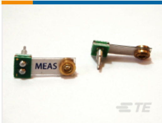
TE 产品编号 CAT-PFS0011 高灵敏度加速度传感器