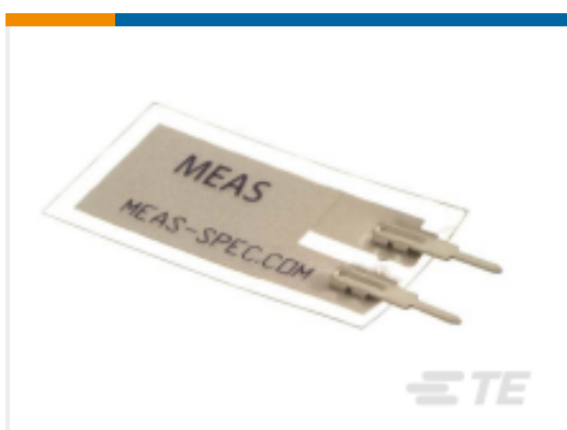
TE 产品编号 11027158-00 不带引线的压电薄膜传感器