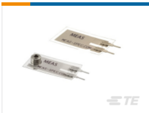
TE 产品编号 11026911-00 压电薄膜加速度传感器/开关