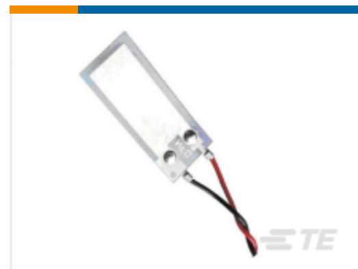
TE 产品编号 11029996-00 带引线的压电薄膜传感器