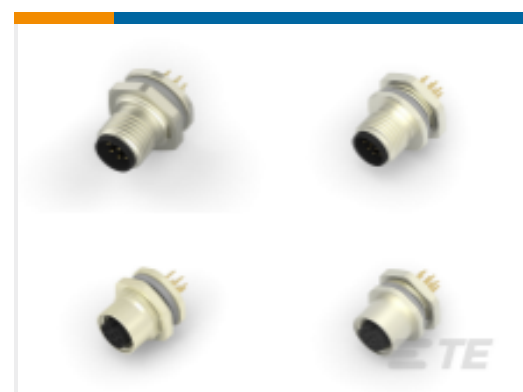
TE 产品编号 T4142512041-000 M12 面板安装 PCB