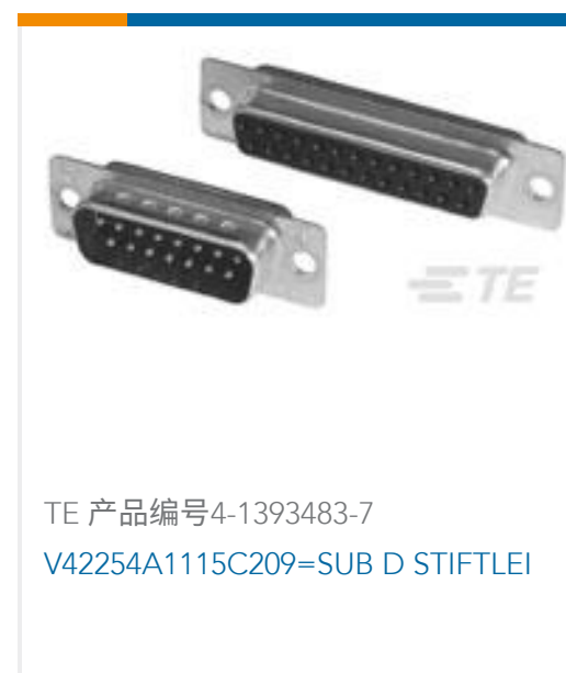
TE 产品编号4-1393483-7 V42254A1115C209=SUB D STIFTLER