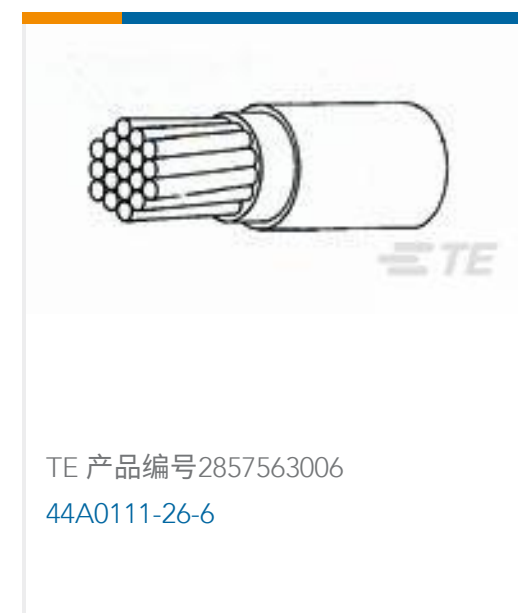
TE 产品编号2857563006 44A0111-26-6