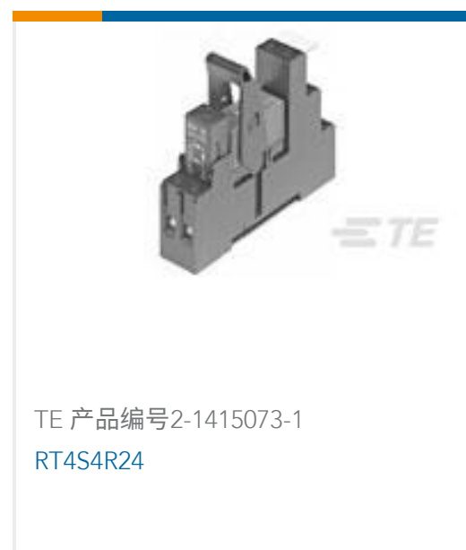
TE 产品编号2-1415073-1 RT4S4R24