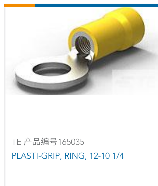
TE 产品编号165035 PLASTI-GRIP, RING, 12-10 1/4