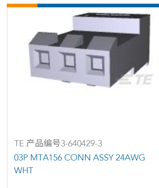
TE 产品编号3-640429-3 03P MTA156 CONN ASSY 24AWG WHT