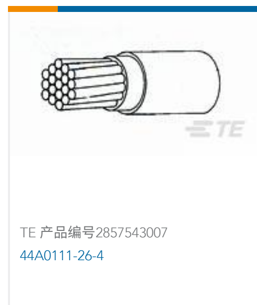
TE 产品编号2857543007 44A0111-26-4