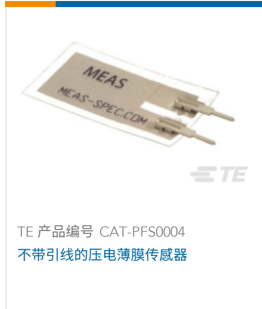
TE 产品编号 CAT-PFS0004 不带引线的压电薄膜传感器