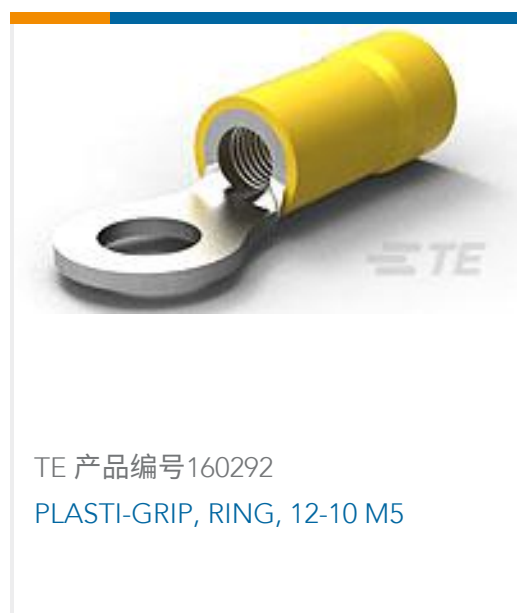
TE 产品编号160292 PLASTI-GRIP, RING, 12-10 M5