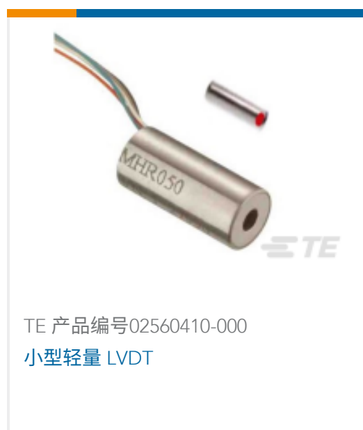
TE 产品编号02560410-000 小型轻量 LVDT