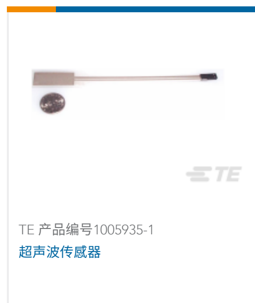
TE 产品编号1005935-1 超声波传感器