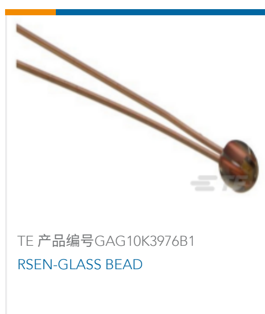
TE 产品编号GAG10K3976B1 RSEN-GLASS BEAD