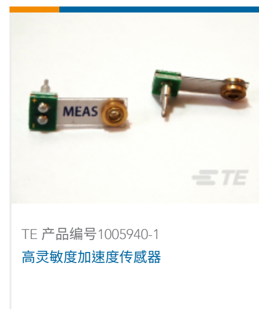
TE 产品编号1005940-1 高灵敏度加速度传感器