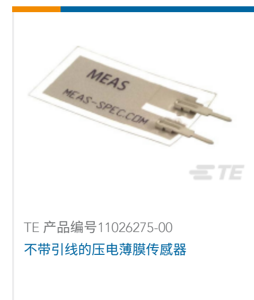
TE 产品编号11026275-00 不带引线的压电薄膜传感器