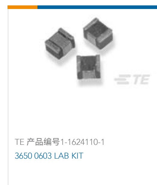
TE 产品编号1-1624110-1 3650 0603 LAB KIT