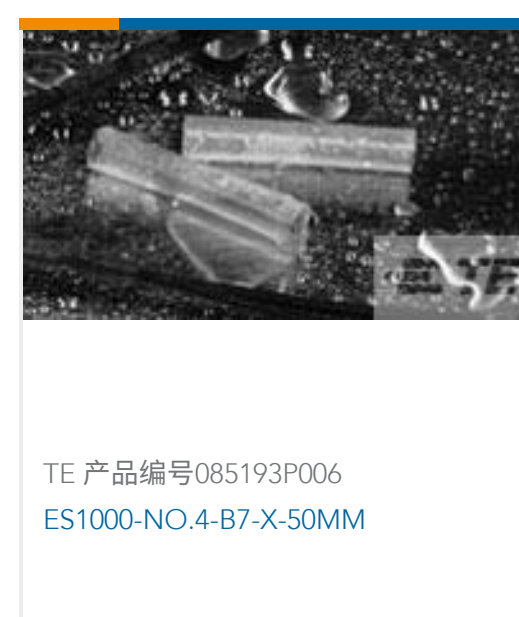
TE 产品编号085193P006 ES1000-NO.4-B7-X-50MM