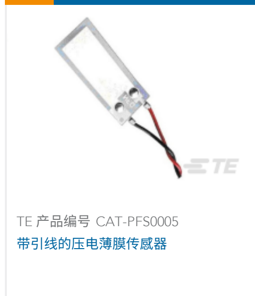
TE 产品编号 CAT-PFS0005 带引线的压电薄膜传感器