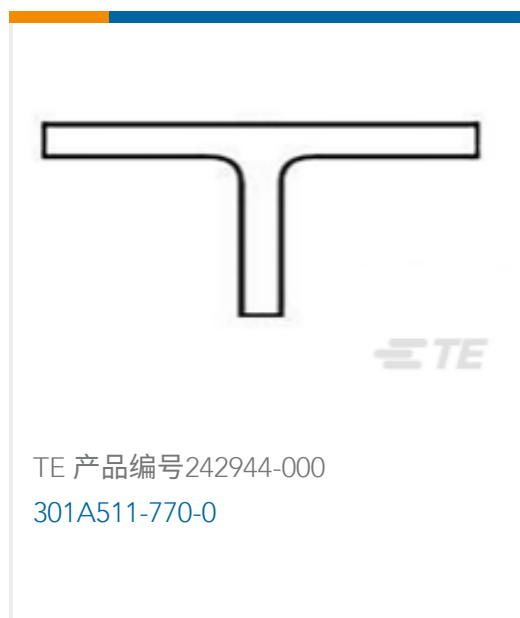
TE 产品编号 242944-000 301A511-770-0