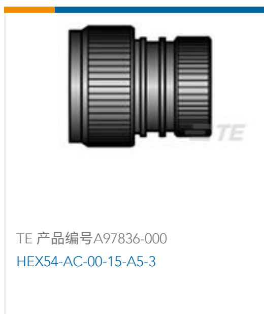
TE 产品编号 A97836-000 HEX54-AC-00-15-A5-3