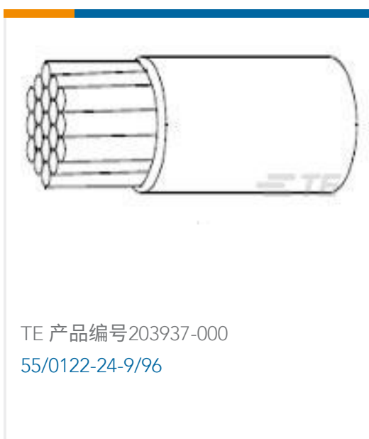
TE 产品编号 203937-000 55/0122-24-9/96