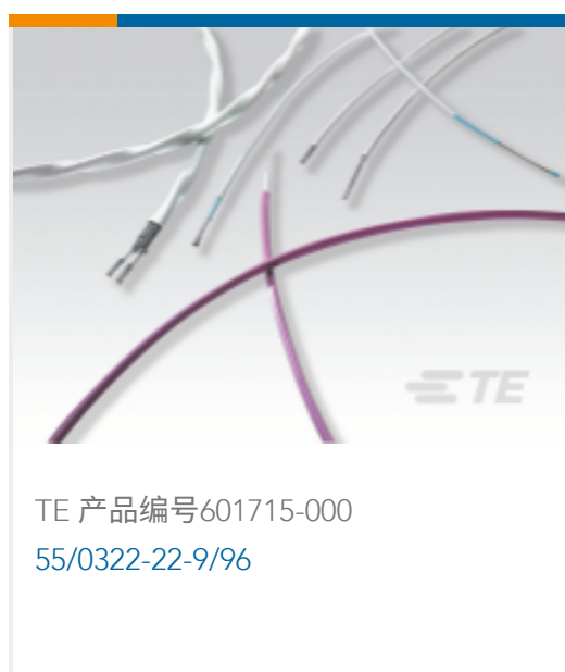
TE 产品编号 601715-000 55/0322-22-9/96