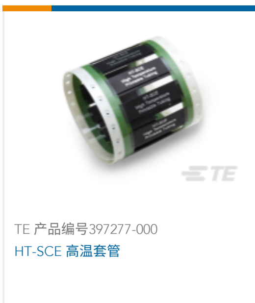
TE 产品编号 397277-000 HT-SCE 高温套管