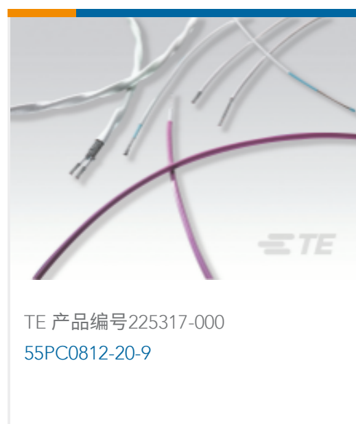
TE 产品编号 225317-000 55PC0812-20-9