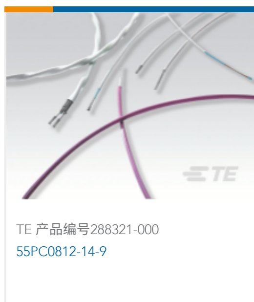
TE 产品编号 288321-000 55PC0812-14-9