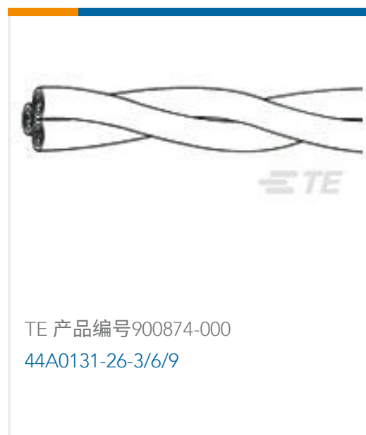
TE 产品编号 900874-000 44A0131-26-3/6/9