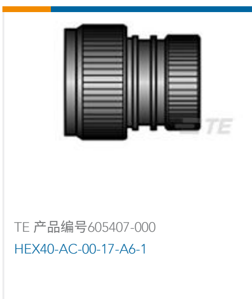
TE 产品编号 605407-000 HEX40-AC-00-17-A6-1