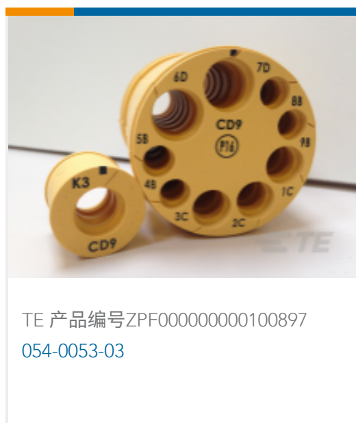
TE 产品编号 ZPF000000000100897 054-0053-03