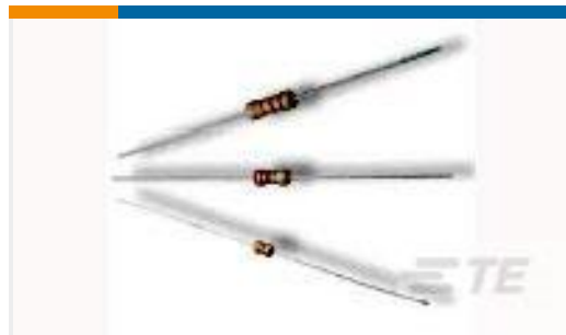
TE 产品编号2-1623931-9 CFR25 5% 3R9