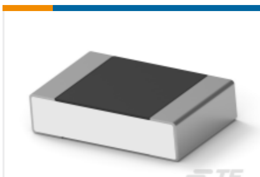
TE 产品编号2-2176373-6 RQ 0805 18R2 0.1% 10PPM 1K RL