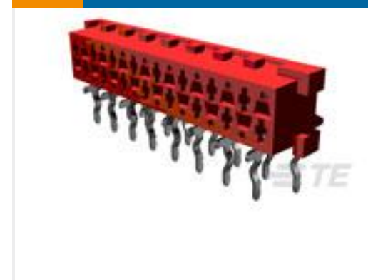
TE 产品编号8-215460-6 MICRO-MATCH FSID P