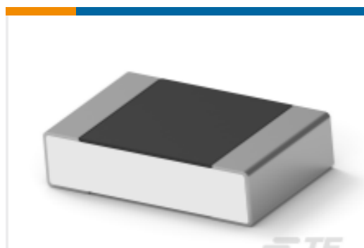
TE 产品编号4-2176373-1 RQ 0805 26R1 0.1% 10PPM 1K RL