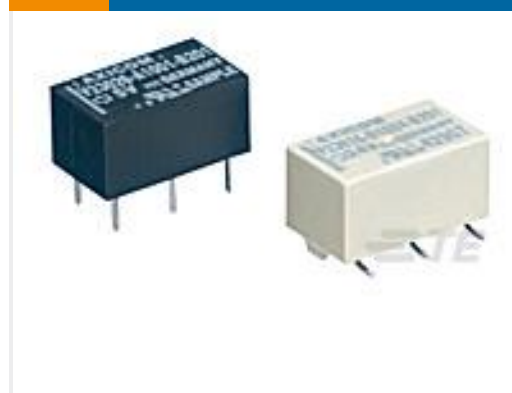
TE 产品编号1-1393774-7 V23026A1006B201