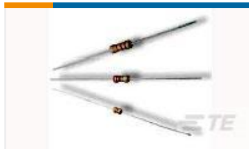
TE 产品编号8-1623931-4 CFR25 5% 8R2