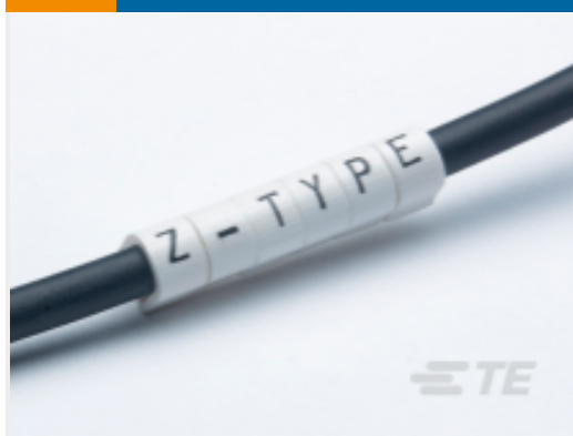
TE 产品编号EJ1954-000 Z-TYPE 推入式标志