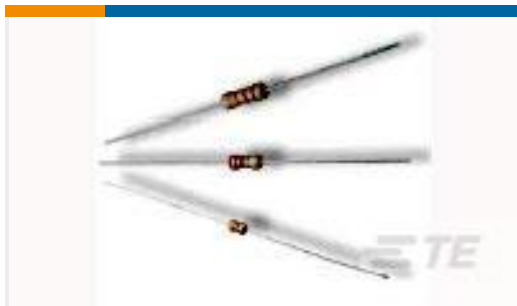
TE 产品编号1-1623931-9 CFR25 5% 39R